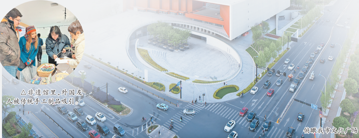
俯瞰我市文化广场