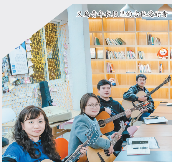
义乌青年夜校里的吉他爱好者