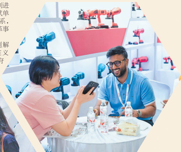
全媒体记者 王婷 谭祉潇 吴峰宇