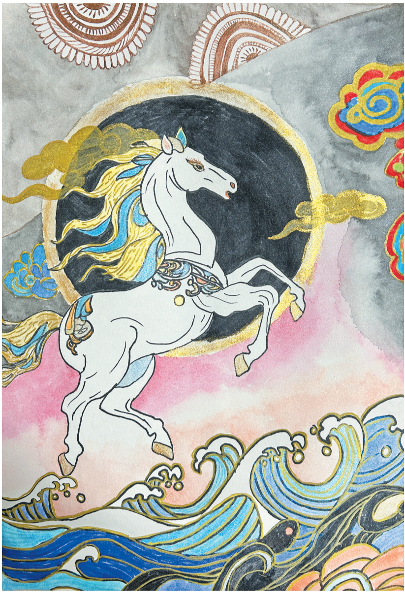
实验小学 305 班蒋承妍