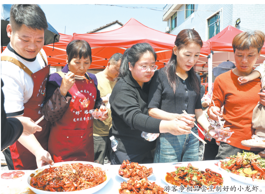
游客争相品尝烹制好的小龙虾。

夜幕徐徐降临,嘉年华的热度却丝毫不减。村道上,村民们手持大小不一、造型各异的龙虾灯,汇成一条璀璨的“龙虾灯阵”。从文化礼堂到龙虾基地,灯阵沿街巡游,祝愿龙虾丰收。暖黄的灯光与欢声笑语交织,点亮了整个村道,也点亮了村民心中的期盼。