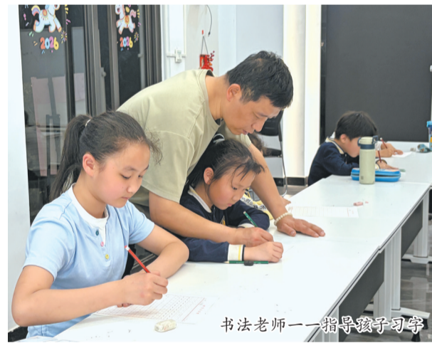
书法老师一一指导孩子习字