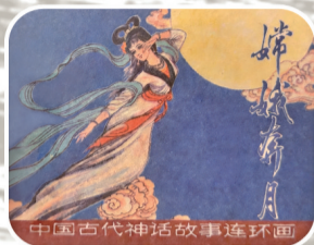
部分展出连环画作品