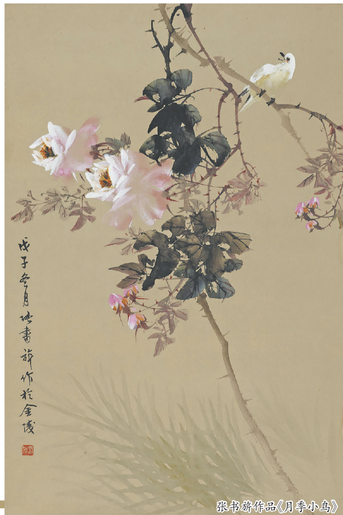
张书旂作品《月季小鸟》