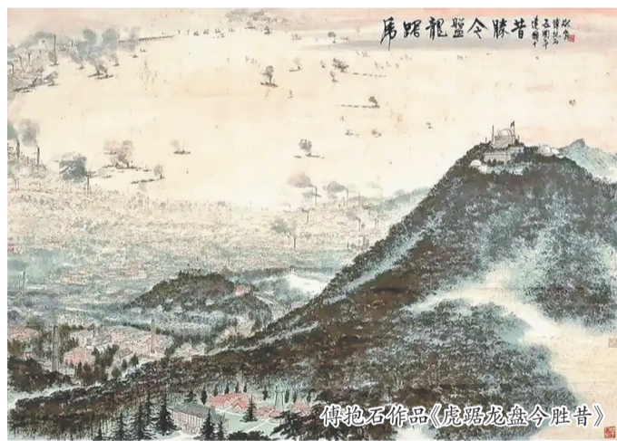
傅抱石作品《虎踞龙盘今胜昔》