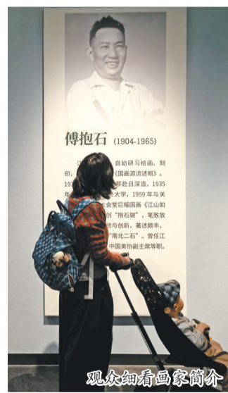
观众细看画家简介

义乌市美术馆相关负责人表示,义乌是敢闯敢创、充满活力的商贸之城,新金陵画派则是中国美术界勇于创新、扎根时代的艺术代表,二者相遇是商业活力与艺术底蕴的美好碰撞,更为义乌文化发展注入新的艺术动能,助力城市文化品位不断提升。