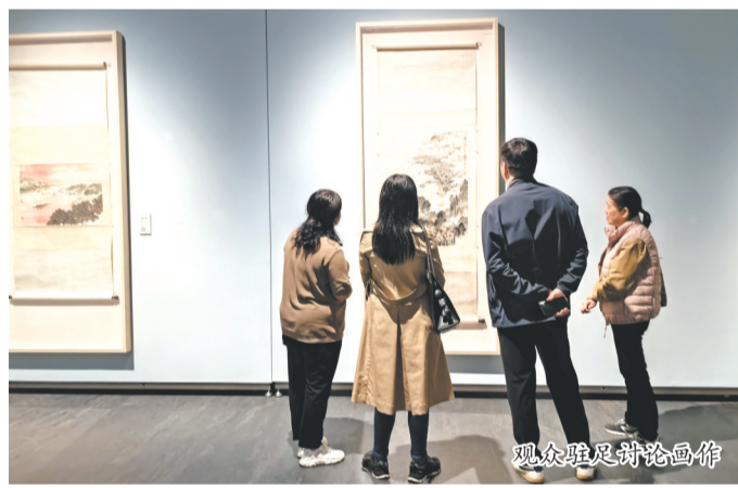
观众驻足讨论画作