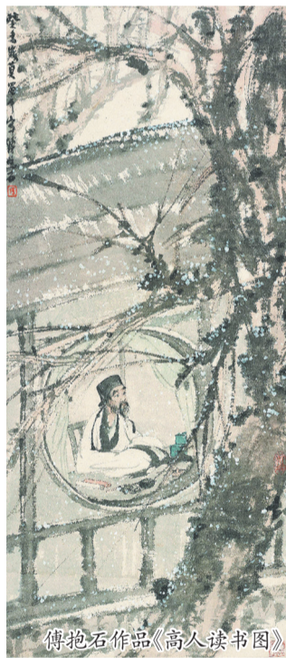
傅抱石作品《高人读书图》

月10日。新金陵画派形成于20世纪五六十年代,以傅抱石为首,汇聚了钱松喦、亚明、宋文治、魏紫熙等一批江苏画家。他们在继承传统的基础上,深入社会现实,推动中国画的笔墨语言随时代创新,逐渐形成了具有鲜明地域特色的艺术流派。作为江苏现代美术的标志性流派,新金陵画派在中国现代美术史上树立了继承传统、锐意创新的典范,创作出一批兼具时代气息与民族特色的新山水画作品,为中国画的创新发展作出了重要贡献。