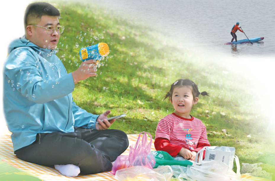
春光正好,家长带着孩子尽情在户外玩耍。