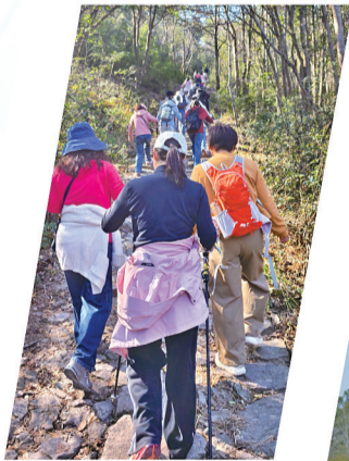
八岭坑古道上的登山爱好者们。