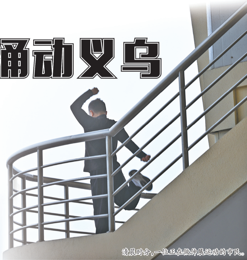
清晨时分,一位正在做伸展运动的市民。