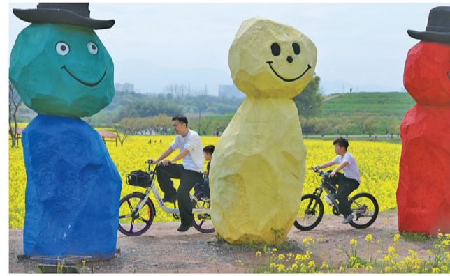
市民骑车经过油菜花田。