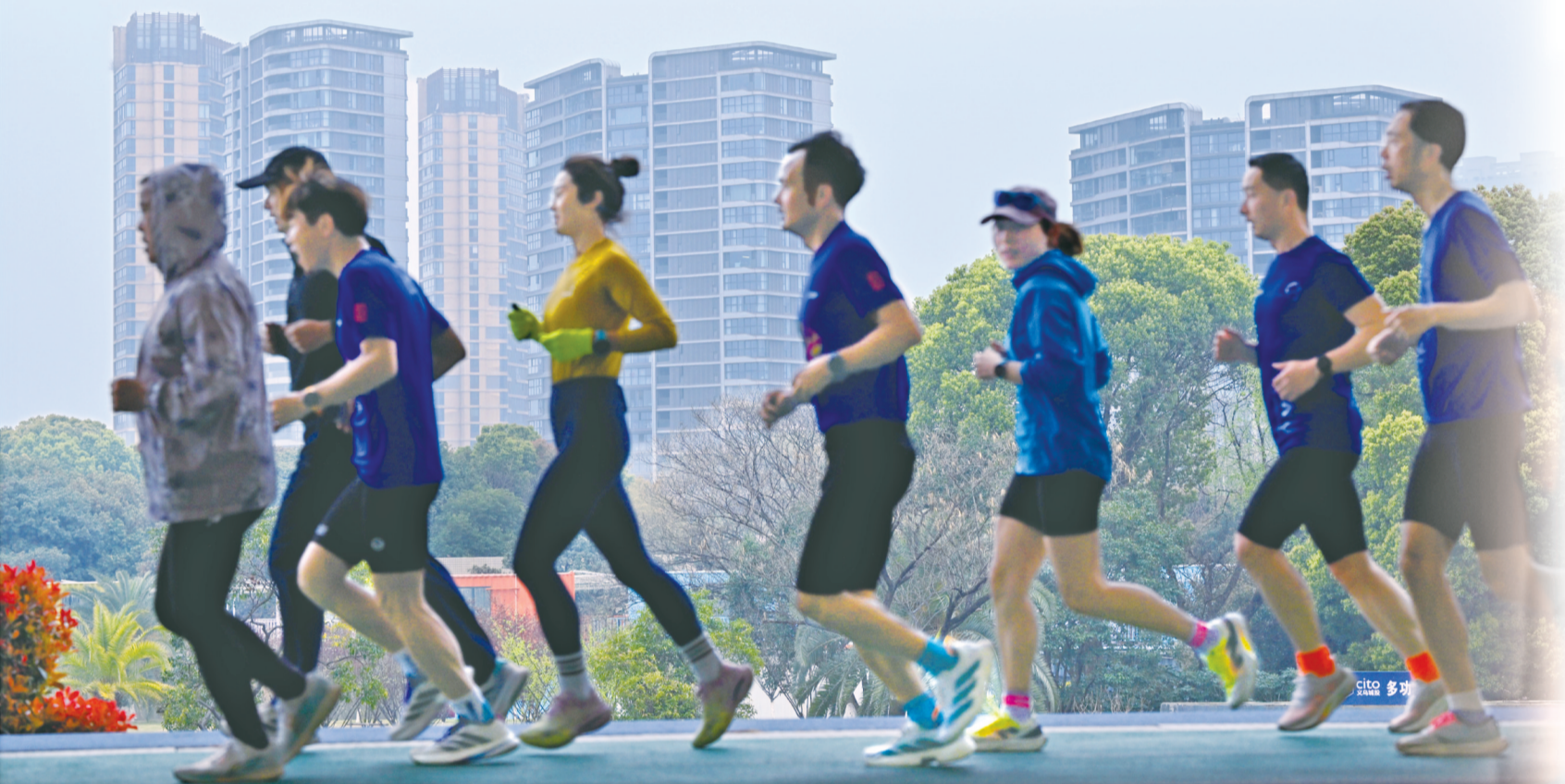
在梅湖体育中心,奔跑中的市民晨跑团。