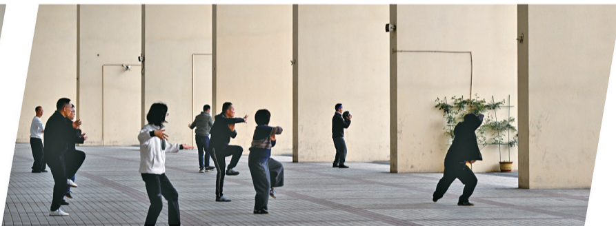
太极拳爱好者正在晨练。