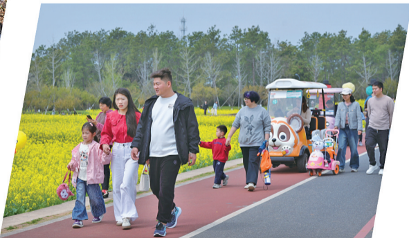
春分节气之后,义乌植物园成了市民散步休闲的好去处。