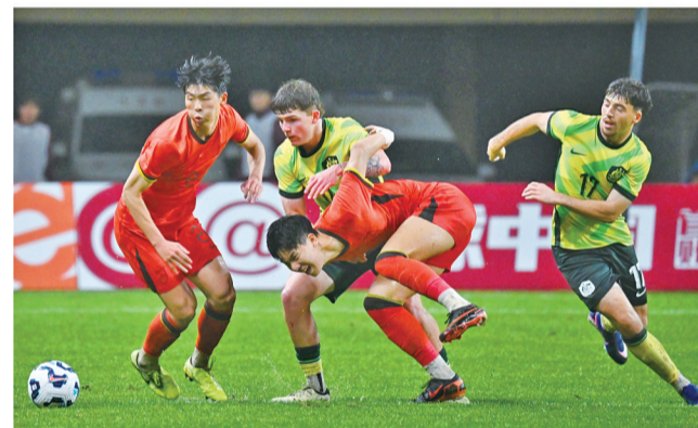
梅湖体育中心足球场,足球队员们正全力拼抢。