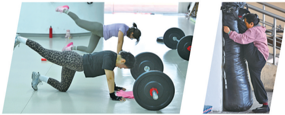
塑形运动训练。 运动前的压腿热身。