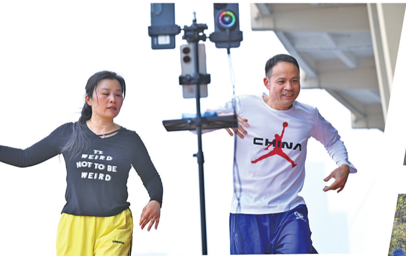
两位热爱运动的中年男女正在进行街舞现场直播。