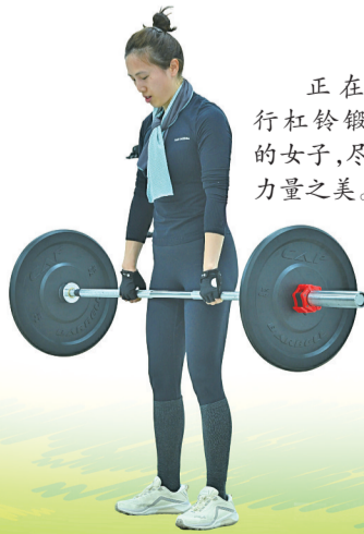
正在进行杠铃锻炼的女子,尽显力量之美。