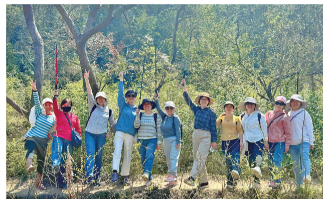
春日里,户外徒步成了不少市民运动休闲的首选。