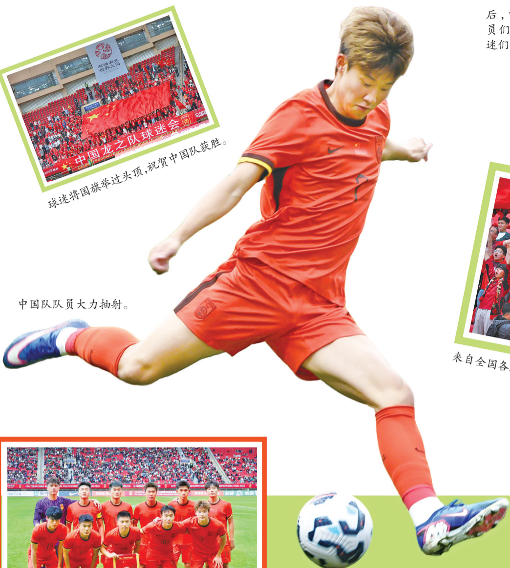
中国队队员大力抽射。