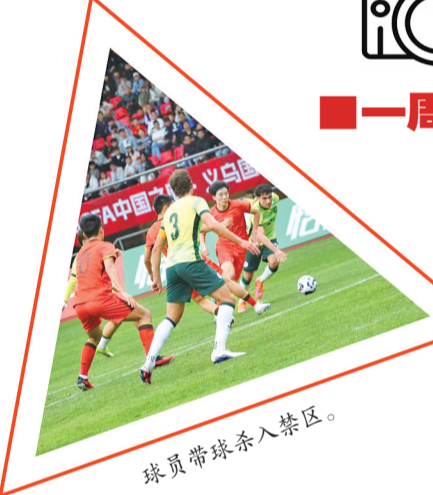
球员带球杀入禁区。

喊。场上双方球员全力以赴,奋力拼搏,攻防转换节奏明快,对抗激烈。每一次边路突破、每一脚威胁传球,都牵动着现场观众的心。每当中国队发起进攻,看台上便响起阵阵欢呼与掌声;精彩的防守化解险情时,也引来阵阵喝彩。全场球迷始终与球队站在一起,用持续不断的助威声为队员们注入动力,热烈的主场氛围成为球队有力的后盾。