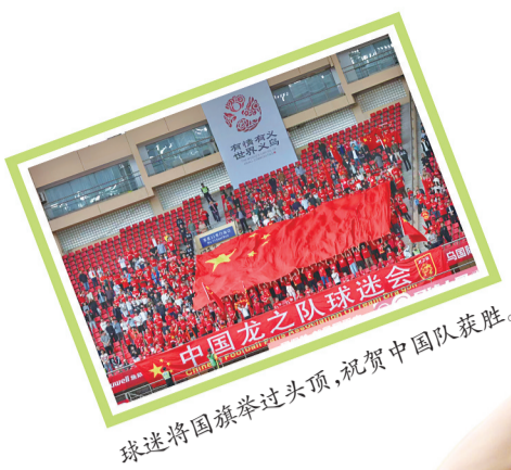
球迷将国旗举过头顶,祝贺中国队获胜。