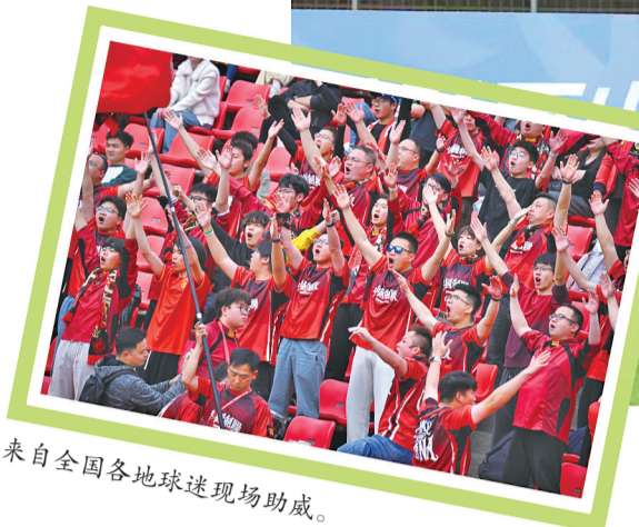
来自全国各地球迷现场助威。