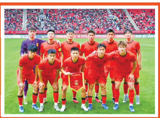
赛前中国队球员合影。