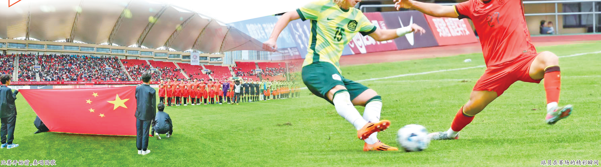
比赛开始前,奏唱国歌