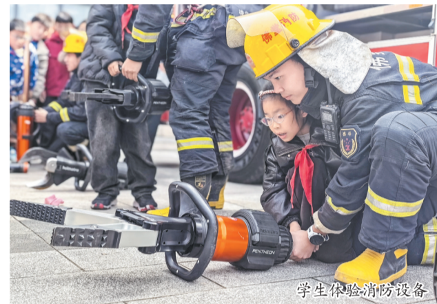
学生体验消防设备

连日来,义乌市凌云消防救援站、佛堂镇应急管理服务站、福田街道应急管理服务站等多家单位,将消防车开进辖区小学,开设“流动课堂”。消防员现场展示各类救援装备,指导小学生试穿战斗服、体验消防车,开展疏散演练。学生们在沉浸式互动中学习消防安全知识。