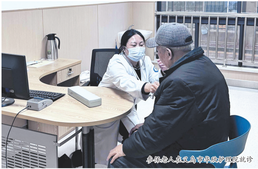
参保老人在义乌市华欣护理院就诊

内老人提供慢特病医保直接结算服务的机构。“从细节入手,把服务流程理顺、管理规范建好,为后续更大范围推广打好基础。”义乌市医保局相关负责人表示。