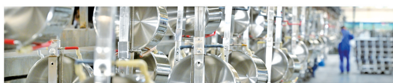
3月5日,浙江永达不锈钢制品有限公司生产流水线上的新品正进行全自动清洗。