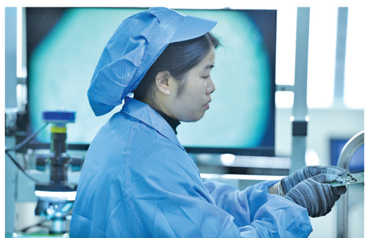
义乌经济技术开发区一高科技生产企业,技术人员在对新能源汽车部件芯片进行检验。