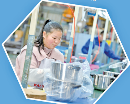
浙江永达不锈钢制品有限公司车间内,工人在包装新款压力锅。