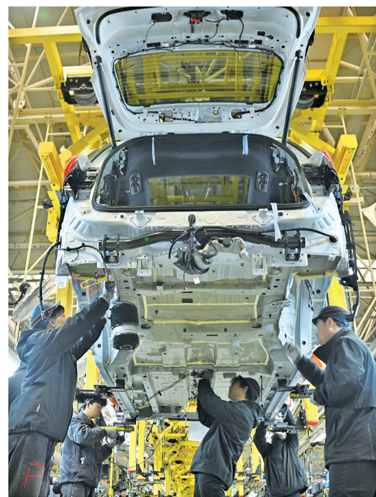
浙江领克汽车义乌工厂生产车间内,技术人员在经过智造升级的总装生产线上进行车辆安装。