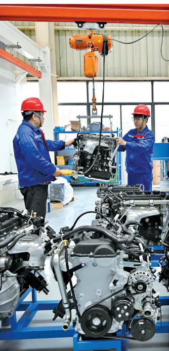
赵龙集团有限公司发动机生产车间,工人正在吊装发动机。