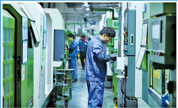
浙江世宝股份有限公司车间内,一线工人进行零部件机床加工。