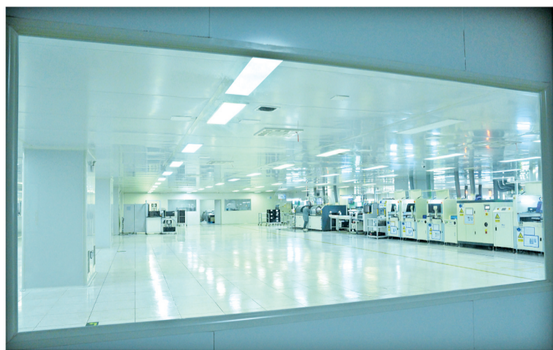
浙江世宝股份有限公司10万等级无尘SMT车间明亮洁净。