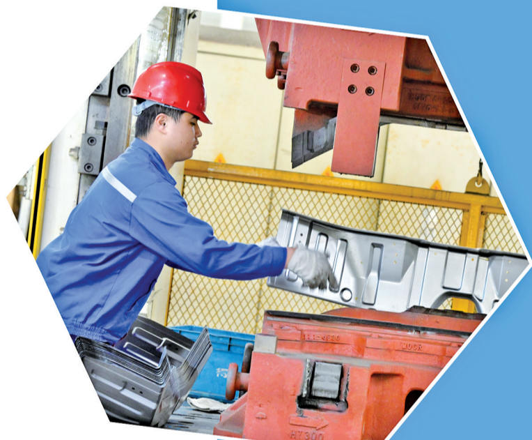
赵龙集团有限公司生产车间,工人正在操作500吨液压机进行压铸作业。

据了解,春节前后,义乌通过举办专场招聘会、开展跨省劳务协作等多种方式,积极推动“送岗上门、送人到岗”。截至目前,市人力资源和社会保障局已累计组织1200余家企业,提供岗位1.5万余个,并创新推出商圈沉浸式招聘、云端直播带岗等新模式,让就业机会更加触手可及。