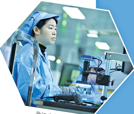
浙江世宝股份有限公司技术人员在进行芯片质检。