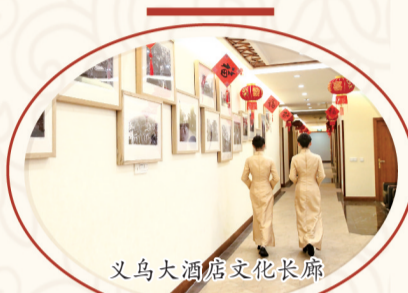
义乌大酒店文化长廊

在当时，“十六汇筵”不仅是一桌美食，更是中国传统思想、伦理、道德和文化在现实生活中的一种体现。