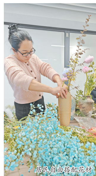
居民自由搭配花材