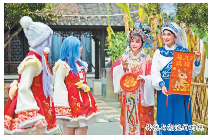
传统与潮流的对话

春节期间，越剧联谊会活动不断、好戏连台。目前，会员们正紧锣密鼓地排练，备战年后的系列晚会演出。