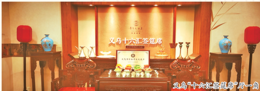
义乌“十六汇筵”厅一角

让我们暂离市井的喧闹，循着古籍的墨香与老饕的追忆，推开那扇通往“舌尖礼乐”的朱漆大门，一探这从满汉全席的云端飘落至民间盛宴的古今传奇。