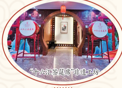
“十六汇筵”非遗工坊