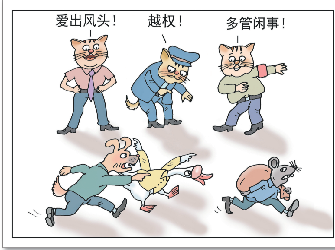
牧野汗/诗 姚月法/图