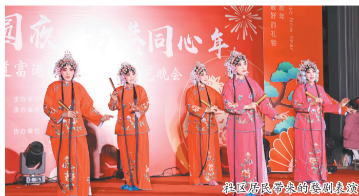
社区居民带来的婺剧表演