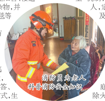
消防员为老人科普消防安全知识