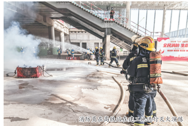
消防员在高铁站在建工地进行灭火演练

演练注重“教、学、练”结合,消防指战员现场指导施工人员操作使用灭火器材,讲授火场逃生要领,确保一线作业人员能够熟练掌握初期火灾扑救与紧急避险的关键技能。