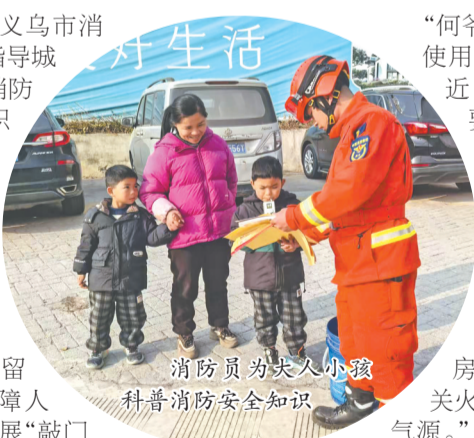
消防员为留守儿童科普消防安全知识

离火种、不随意触碰电器设备。此外,针对“一老一小一特殊”群体,城西街道联动辖区村社建立“一人一档”帮扶档案,结合“邻里守望”机制,明确邻里帮扶责任人,定期上门走访,确保及时发现和消除隐患,特殊群体安全需求得到回应,为他们构建“消防+网格+村民”三级联防联控体系。行动中,他们累计走访“一老一小一特殊”家庭150余户,发现并消除火灾隐患130余处,惠及群众400余人,为弱势群体筑起暖冬“防火墙”。