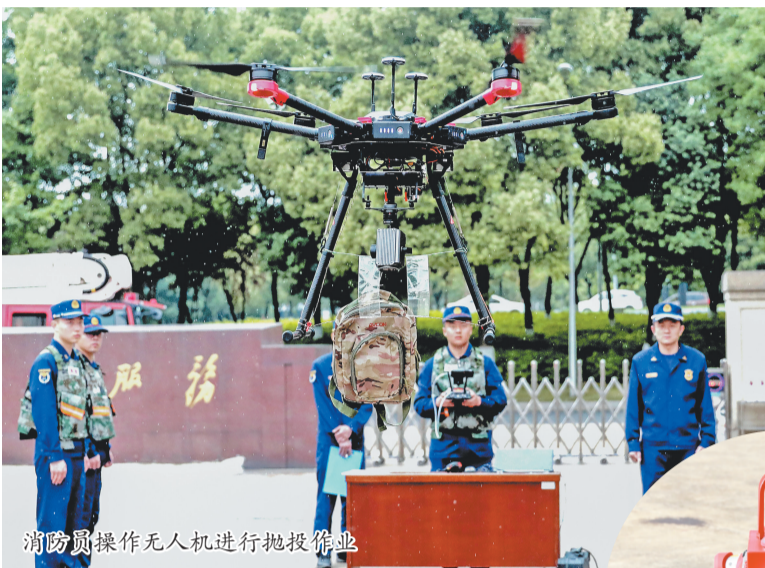
消防员操作无人机进行抛投作业

佛堂镇依托“治理通平台2.0”,推行“一户一码”,实现隐患上报、整改、核查线上闭环,1.6万家市场主体以“红黄绿蓝”四色标识动态更新风险等级,全年累计处置隐患8.5万余,整改率达100%。江东街道部署21万个智慧烟感设备,服务34.85万人、23.3万家市场主体,构建“智能预警—精准派单—高效处置”闭环。北苑街道则补齐“九小场所”消防安全短板,为5000余家“九小场所”联网安装1.1万余个智慧烟感报警器。此外,在福田街道,人大代表、志愿者、社区联动,引入电动自行车智能换电柜,外卖骑手1分钟完成换电,智慧治理“飞线充电”乱象,化“民生堵点”为“安全亮点”。