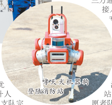
消防机器人狗登陆消防站

义乌市常驻外商达1.5万人,为破解语言障碍,119指挥中心创新“三方通话”机制,外语报警接通后,转接对应语种专家,实现接警员、翻译、报警人实时通话,覆盖阿拉伯语、西班牙语等“一带一路”主要语种。以指挥中心为核心,联动8个涉外社区微型消防站及多支国际消防志愿者队伍,构建“1+8+N”涉外应急救援网络,常态化开展多语种安全培训,编制外文应急手册,有效提升涉外火警处置效率。