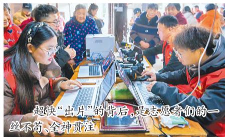
超快“出片”的背后,是志愿者们一丝不苟、全神贯注