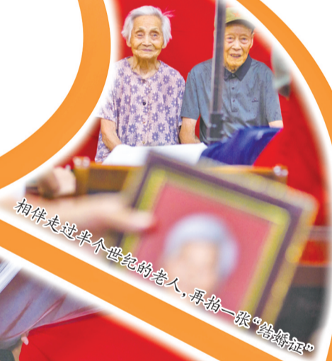
相伴走过半个世纪的老人,再拍一张“结婚照”