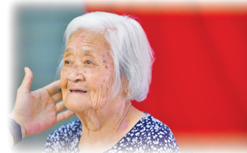
“奶奶,脸稍微往这边移一点。”