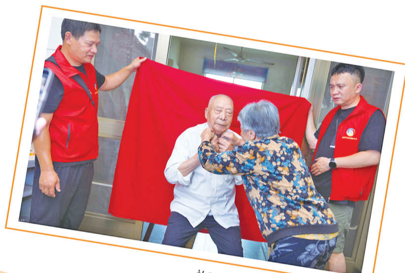
拍照前,奶奶细心为老伴系上纽扣。