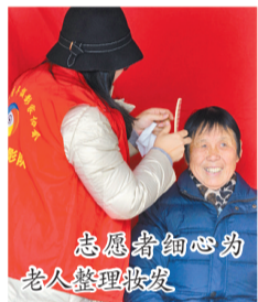
志愿者们细心为老人整理妆发