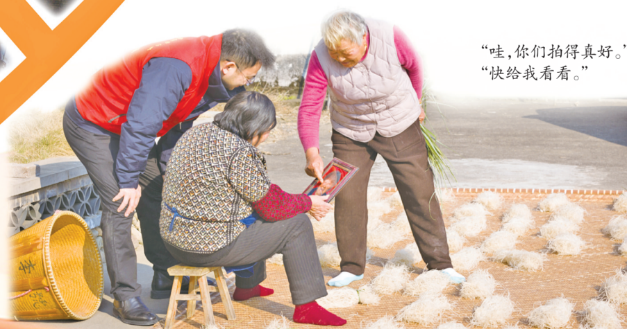
“哇,你们拍得真好。” “快给我看看。”