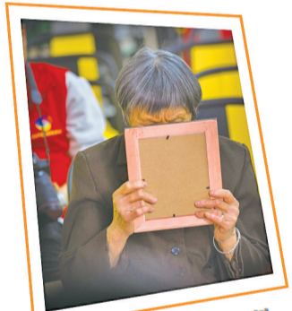
看到照片,老人掩面落泪。