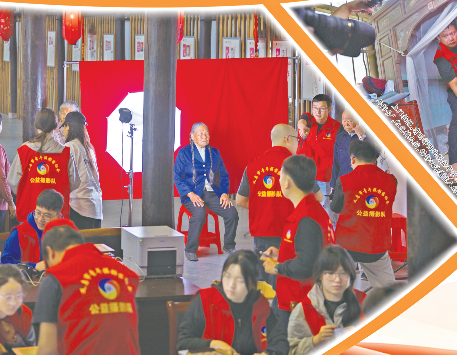
每次“送照片下乡”,都需要约20位志愿者组成一个高效团队