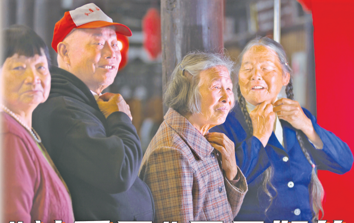
马上开拍,一起整理衣服的老人们