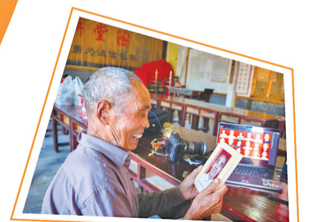
拿到照片的老人笑着说:“终于可以给孩子留下一张好照片了。”