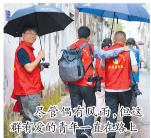
尽管偶有风雨,但这群有爱的青年一直在路上