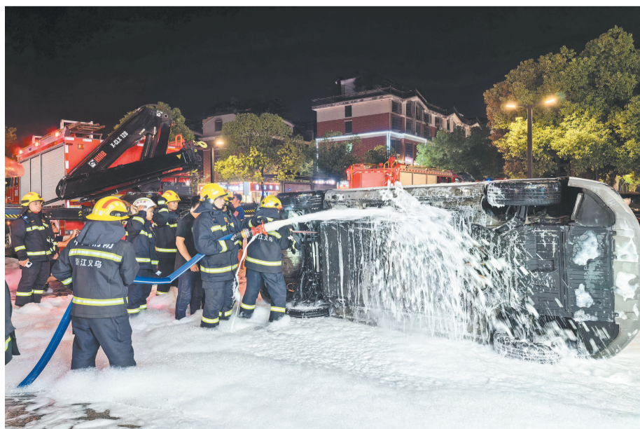
9月4日0时56分,义乌市一辆汽车突发冒烟。消防员迅速赶赴现场,使用泡沫灭火技术精准灭火。