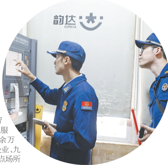
“双十一”前后,义乌市消防救援支队指导顺丰、中通、韵达等快递企业开展消防安全检查、宣传、演练。

此外,支队全面推进智慧消防建设,在江东街道开展试点,召开全市“智慧消防”建设推进会,推广“人防+技防”深度融合经验;探索应用登高面占用监测、消控室离岗预警等物联网感知设备,推动“135”快速应急响应圈建设。全市已建成智慧消防应急站121个,配备专业技术服务人员695人,接入物联网感烟140余万只、远程监控1800余套,覆盖工业企业、九小场所、沿街店面、出租房等各类重点场所10.9万余处,火灾防控精准度和时效性显著提升。2025年,全市火灾起数同比下降,未发生亡人及有影响的火灾事故,火灾形势总体平稳。