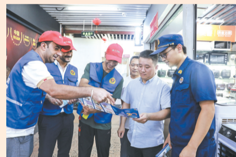
7月17日至18日,“洋更夫”消防志愿者服务队走进市场,开展消防安全宣传。