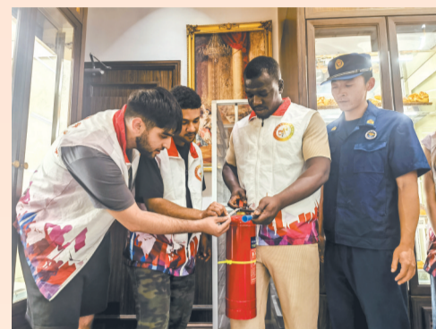
4月9日,义乌市成立全国首支“洋更夫”消防志愿者服务队。

“邹宁浩烈士是支队全体消防救援人员学习的榜样。我们将传承烈士遗志,接过他肩上的担子,全力当好人民安全‘守夜人’。”在国庆节、烈士纪念日、清明节等重要节点,支队通过老消防员带领新消防员举行升旗仪式、前往武义和义乌两地烈士陵园祭扫等活动,全面开展思想政治教育。支队坚持教育铸魂,深化“大水漫灌、细水浇灌、精准滴灌、喷水洒灌”思政教育模式,有序推进改革期间思想工作,搭建“话系列”“走村入企”平台载体,举办2届环幸福湖“消”跑活动,通过“面对面”思想碰撞、“心贴心”交流讨论,不断凝聚队伍破题攻坚、改革争先的实干氛围,汇聚蓬勃向上的奋进力量。