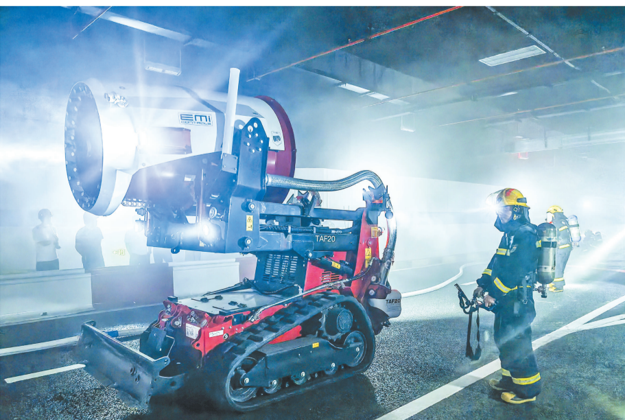
5月21日晚,义乌市消防救援支队联合多部门在福田街道金融商务区地下隧道举行车辆火灾夜间救援实战演练。