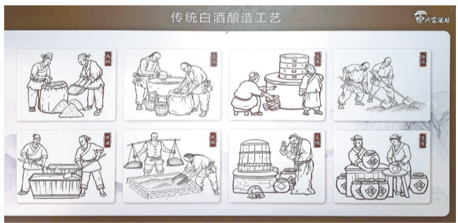
传统白酒酿造工艺