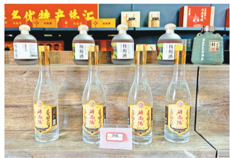
展厅内的“醉尚阳”品牌白酒。

如今,酒坊内蒸汽昼夜缭绕,传统匠艺与现代规范在此交融。新酒初出时,许多村民围聚坊前,一位白发老者掏起一捧轻嗅,眼角泛起泪光:“是小时候的香气……这味道回来了。”