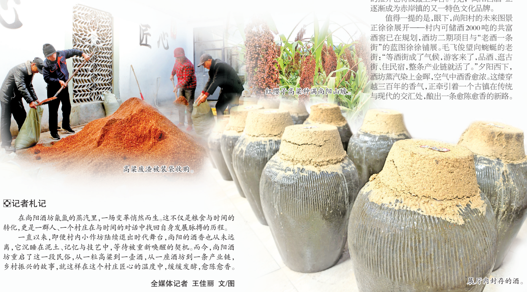
高粱废渣被装袋收购。