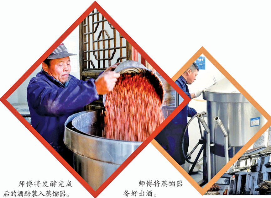
师傅将发酵完成后的酒醪装入蒸馏器。