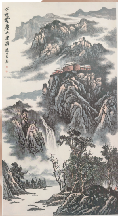
巨制《心境无尘山更幽》