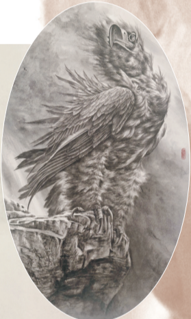
画作《吾欲乘风傲苍穹》(局部)