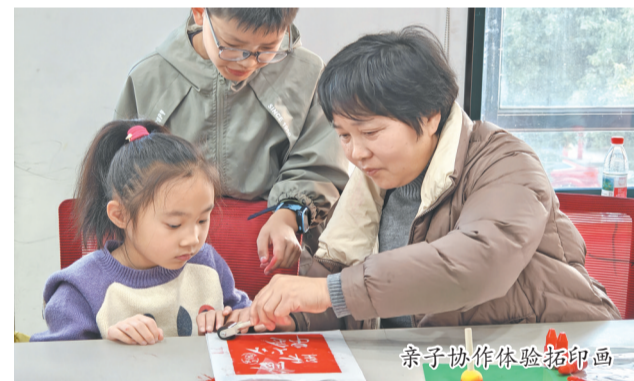
亲子协作体验拓印画