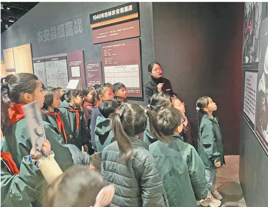
△联港小学学生参观侵华日军细菌战史实陈列馆展厅。 ▷北苑街道四季社区流动党员和同悦社工悼念遇难同胞。