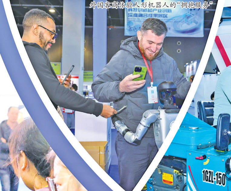
外国客商体验人形机器人的“拥抱服务”。