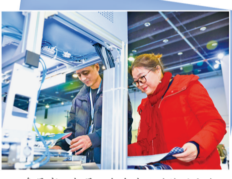
参展商互相展示各自产品的使用方法。