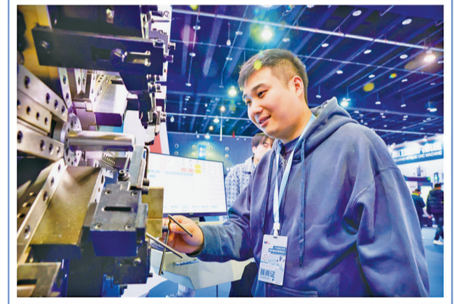
参展商演示器械使用方法。