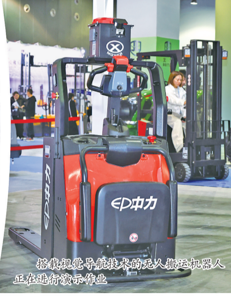
搭载视觉导航技术的无人搬运机器人正在进行演示作业。