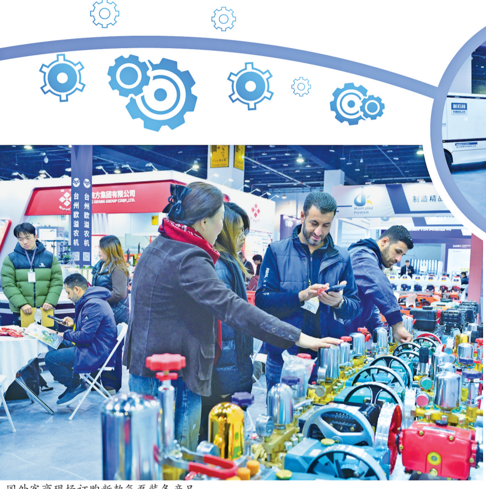
国外客商现场订购新款气泵装备产品。