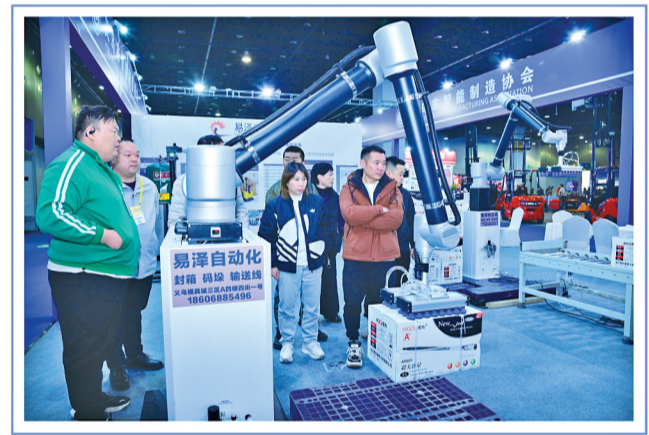
新款全自动物流运输装备。