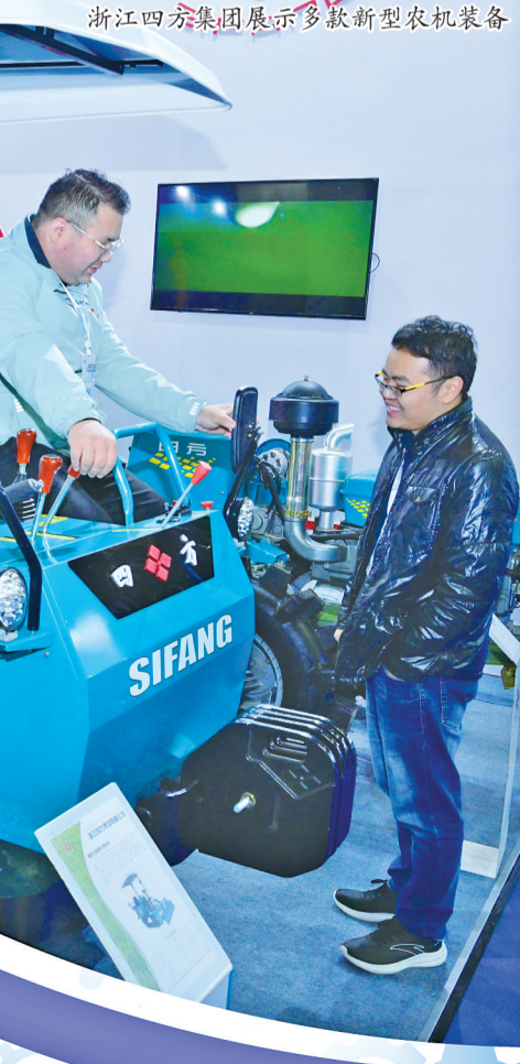
浙江四方集团展示多款新型农机装备。