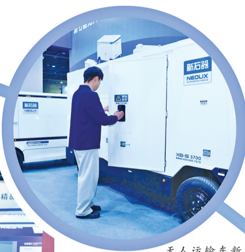
无人运输车新上市备受客商关注。