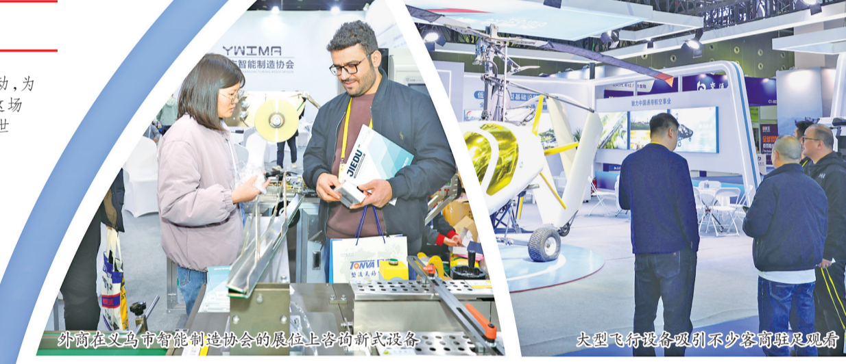
外商在义乌市智能制造协会的展位上咨询新式设备。