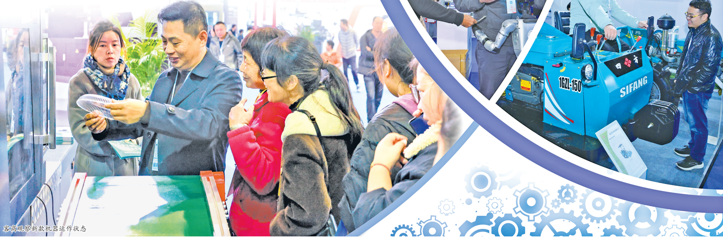
客商观察新款机器运作状态。