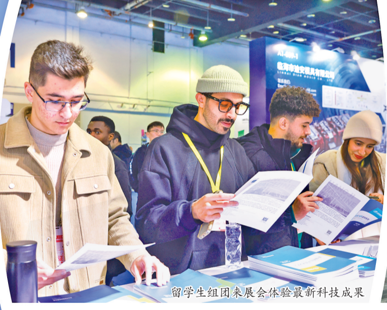
留学生组团来展会体验最新科技成果。