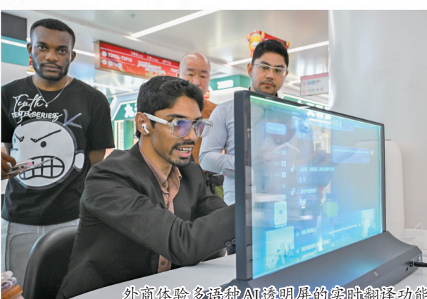
外商体验多语种AI透明屏的实时翻译功能。