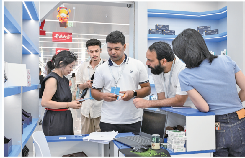
外商们与经营户洽谈AI耳机采购事宜。