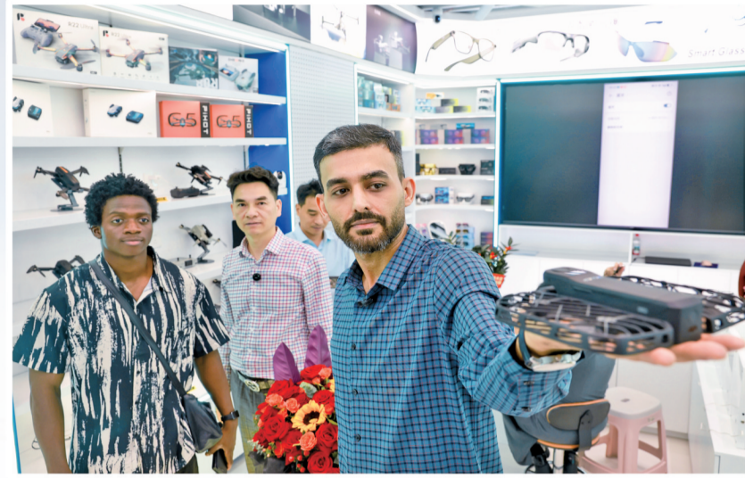
外商尝试操作无人车。