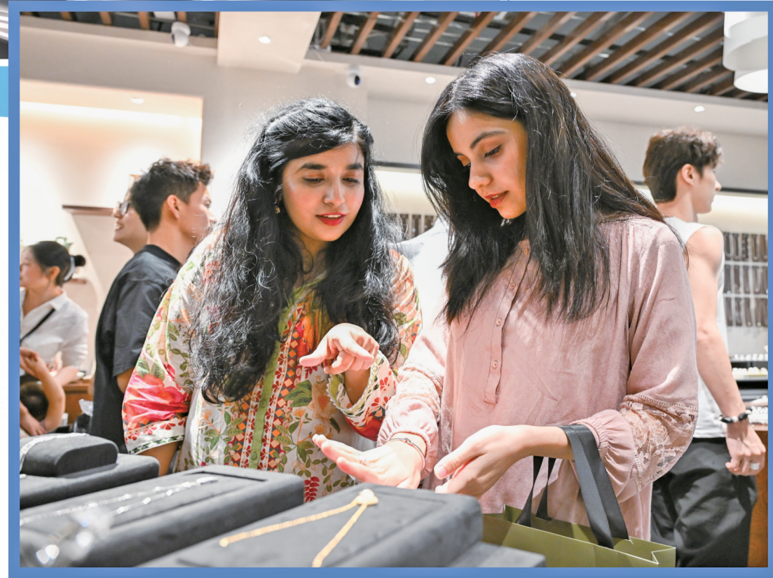
外商们对精美的时尚珠宝爱不释手。