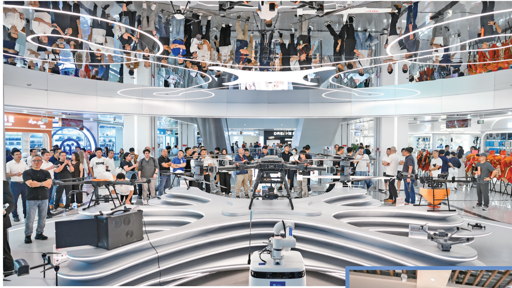
无人机展区吸引多国游客驻足参观。