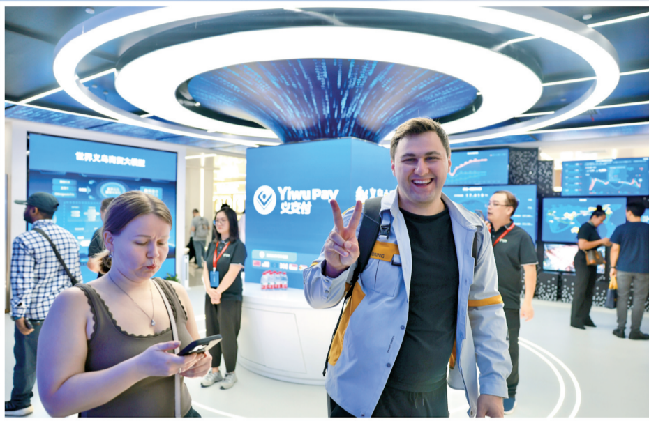
外商在数字贸易服务中心处兴奋比“耶”。