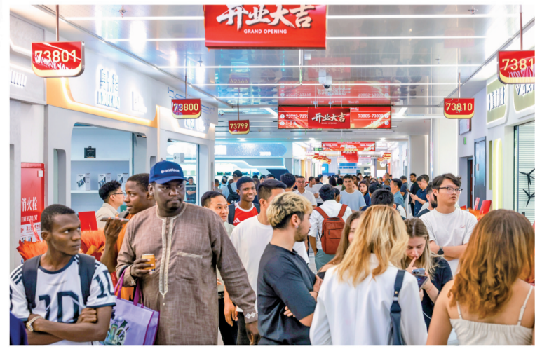
开业首日,万名外商涌进全球数贸中心。