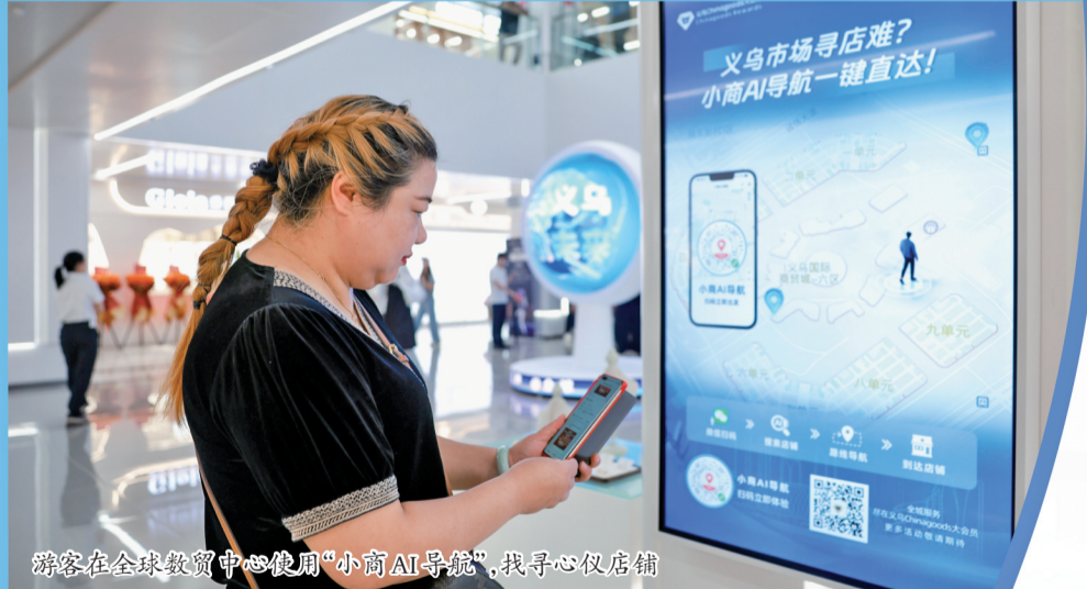
游客在全球数贸中心使用“小商AI导航”,手机心应手。