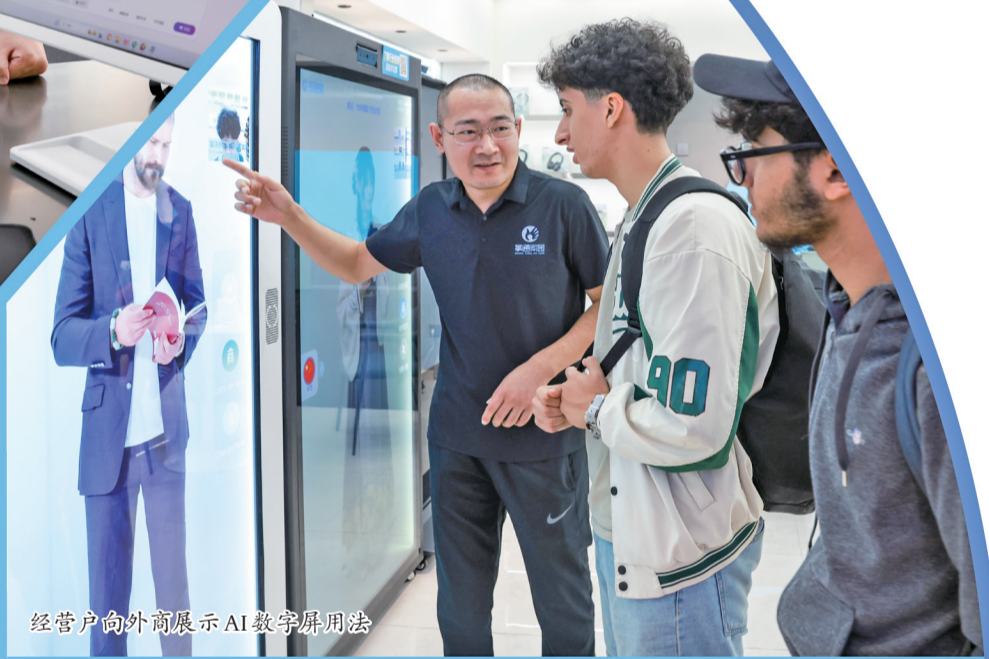
经营户外商展示AI数字屏用法。