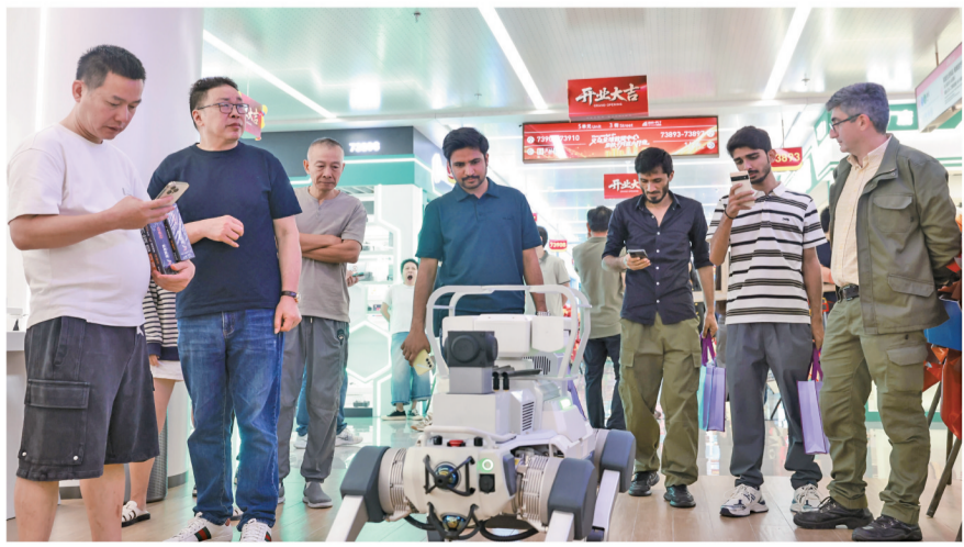
正在巡演的机器人吸引多名外商跟拍。