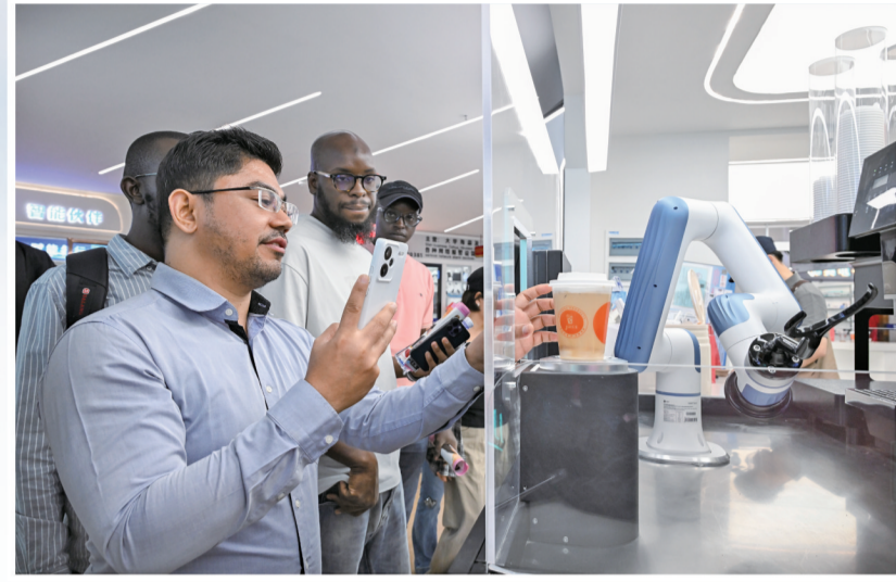
在机器人的自动操作下,一杯咖啡被递到外商手中。