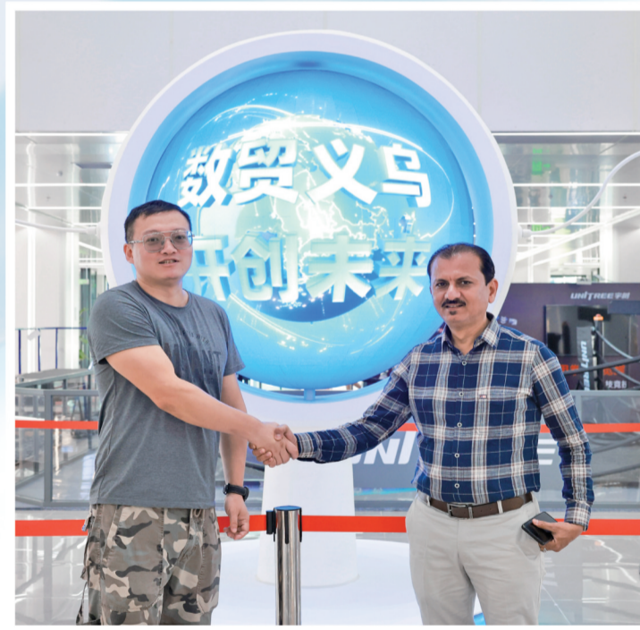
与客商开心合影留念。