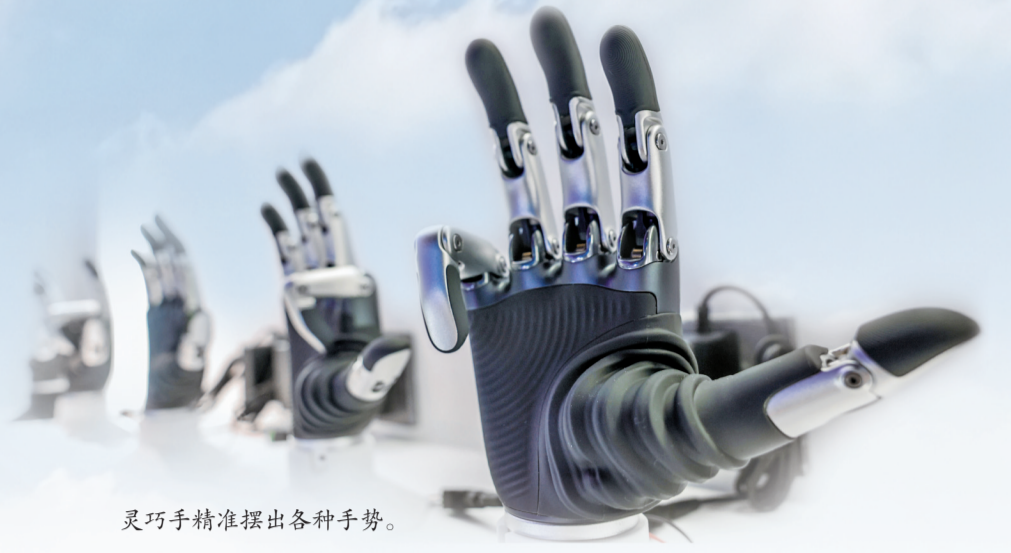
灵巧手精准摆出各种手势。