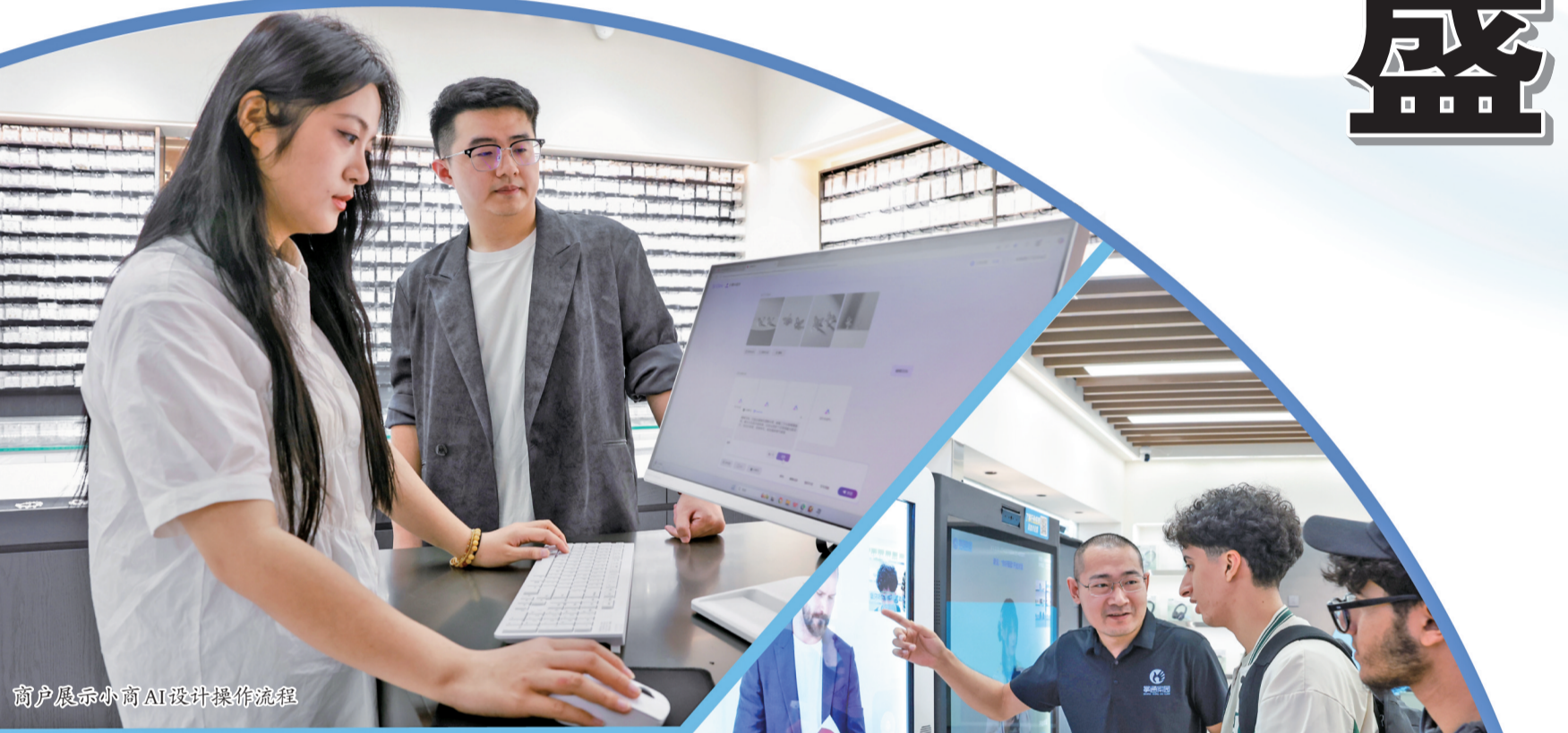
商户展前向AI设计师操作流程。