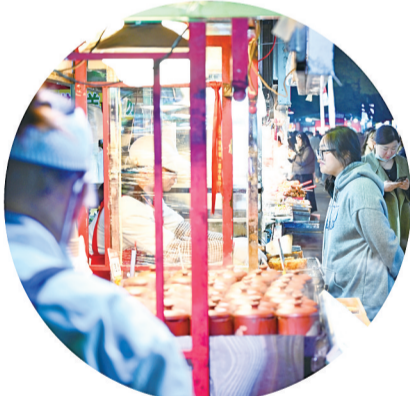
食客们耐心等待美食制作完成。