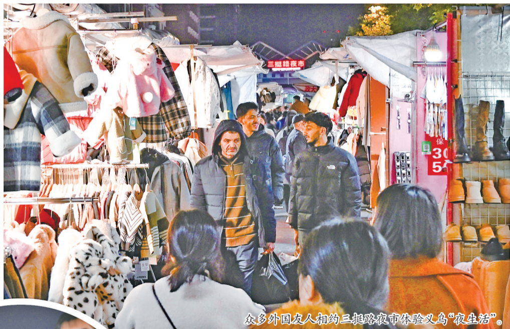
众多外国友人相约三挺路夜市体验义乌“夜生活”。