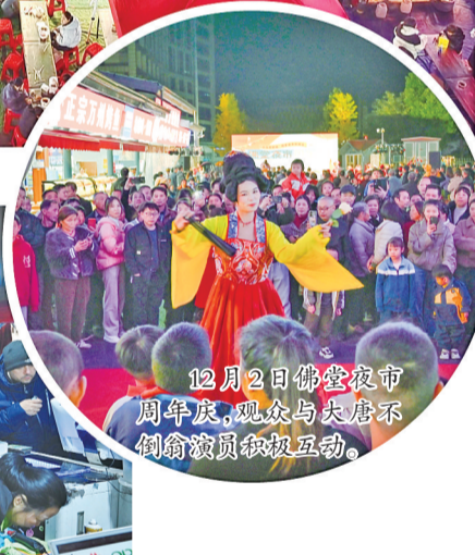
12月2日佛堂夜市周年庆典,观众与演员不断互动。