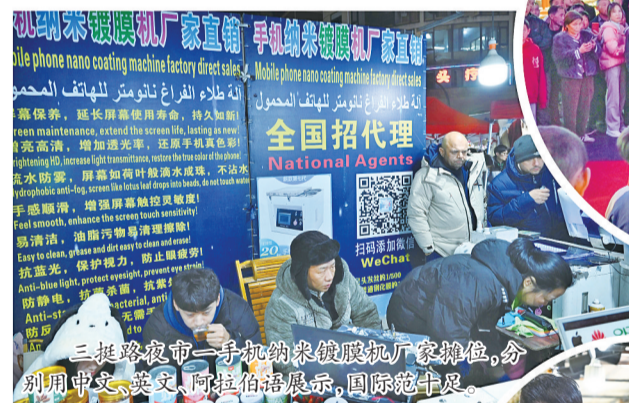
三挺路夜市一手机纳米镀膜机厂家摊位,分别用中文、英文、阿拉伯语展示,国际范儿足。