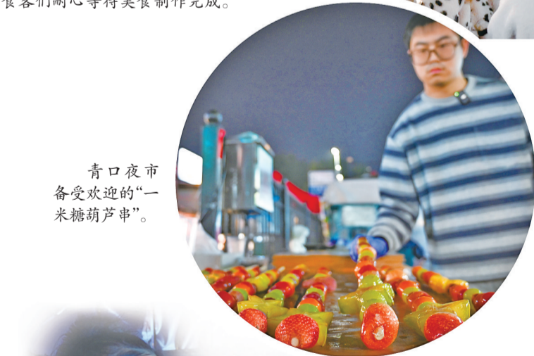
青口夜市备受欢迎的“一米糖葫芦串”。