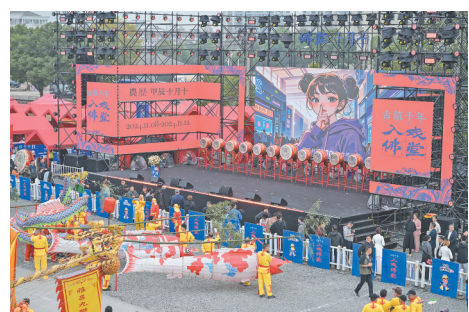
佛堂十月十主舞台

佛堂十月十期间,书法、美术、摄影等四大展同时开展。各个艺术领域的艺术展“百花齐放”,呈现出了“大美佛堂”丰富历史人文底蕴,也让佛堂十月十这场文化盛宴变得更加精彩。游客们在体验民俗活动的同时,也感受到了佛堂古镇传统文化的独特魅力。