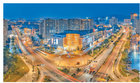
佛堂夜景

佛堂十月十期间,佛堂物资交流会里的首届汽车文化展吸引了众多游客的目光。这也是佛堂十月十举办这么多届来,第一次出现了车展的“身影”。