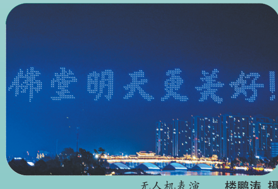
无人机表演