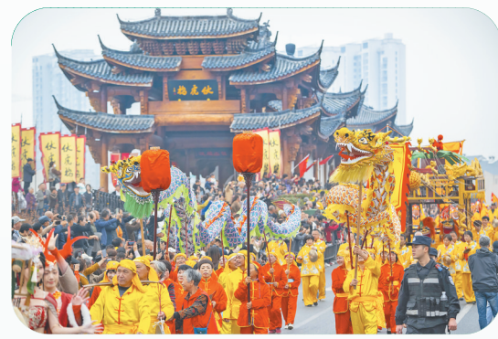
民俗活动

加快城乡融合,古镇迎来蝶变。聚焦“走在前、勇争先、善作为”的目标要求,佛堂镇将着力激发经济发展新活力,打造城乡融合新风貌,顺应群众生活新期待,奋力谱写中国式现代化的佛堂篇章,为义乌“打造典范 再造辉煌”提供佛堂力量。