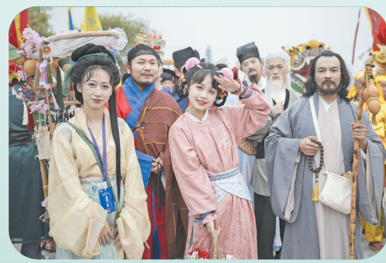
文旅IP人物