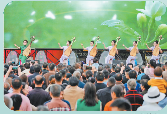
曲艺演出