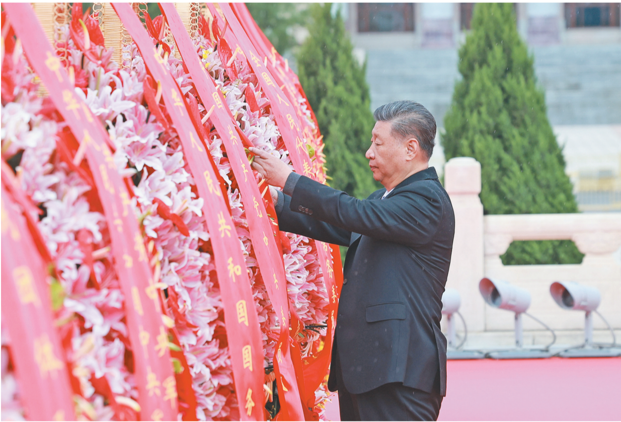
9月30日上午，党和国家领导人习近平、李强、赵乐际、王沪宁、蔡奇、丁薛祥、李希、韩正等来到北京天安门广场，出席烈士纪念日向人民英雄敬献花篮仪式。这是习近平整理花篮上的缎带。