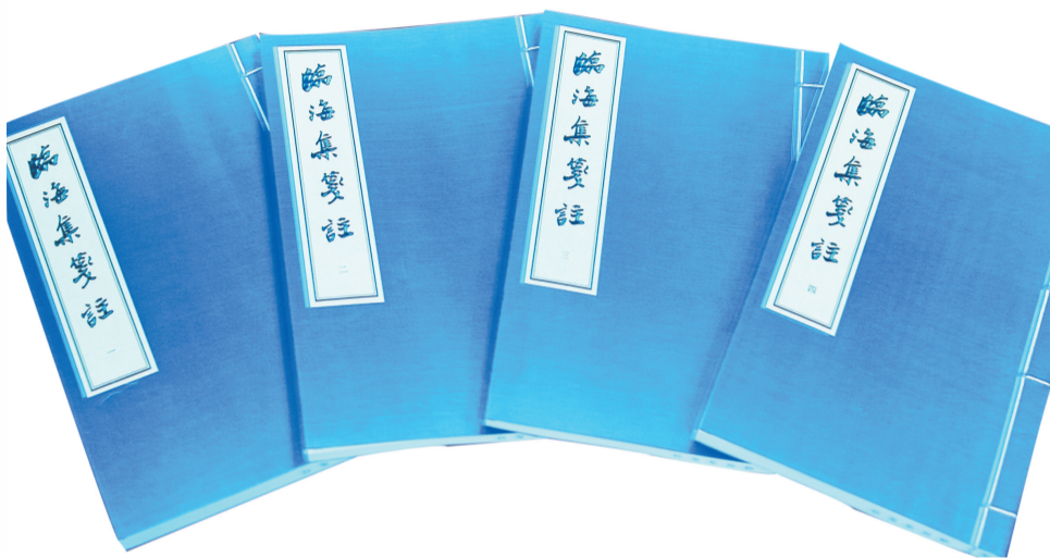
《临海集笺注》影印本。

后世人所喜爱。但郗云卿所辑之10卷本,在流传中已多散佚,后人又收集了很多骆宾王的诗文,其中在明清以来就出现有4卷本、6卷本和10卷本等多种编辑本及注本,其所收篇目大致相同。其中以清代陈熙晋编纂的《骆临海集笺注》最为完备,共收集有骆宾王各体诗歌131首、赋2章、颂1章、文(包括启、书、状、露布、对策、檄文等各种体裁)38篇。