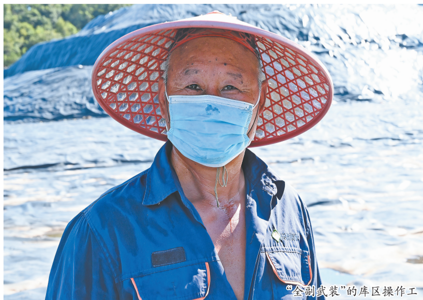
“全副武装”的库区操作工

高温考验下,掀膜、覆膜、焊膜、库区雨污分流、库区环境卫生保洁……10位操作工顶着烈日在垃圾堆体上完成各项工作。为顺利打开垃圾开挖作业面,确保垃圾暴露面全覆盖,防止垃圾臭味飘散,操作工需要爬上“垃圾山”,全员齐心协力拉动覆盖在垃圾堆的黑色HDPE膜。在高温下,黑色HDPE膜的表面温度高达70℃,操作工必须借助“大力夹”才能完成掀膜、覆膜。