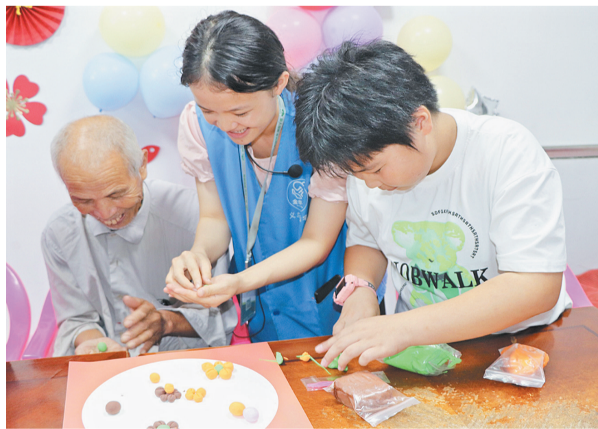
老少一起制作手工黏土花。

据了解,本次活动是后宅社工站推出的“流动生日包”项目中重要组成部分,让孩子们从过生日的受益人,经过社工的赋能成为设计生日的参与者、为他人庆生的服务提供者。后宅社工站相关负责人表示,他们将继续发挥社会工作专业优