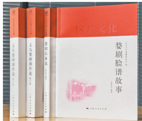
《义乌婺剧剧作选》《婺剧乐曲选》《婺剧脸谱故事》

在旧社会,戏剧的传承,基本上靠口口相传,由于封建统治者对戏曲的不重视及对艺人的歧视,历史上能够用文字记载的婺剧资料寥若晨星。新中国成立以后,偶有发现的一些手抄剧本,不少是年过古稀的老艺人口述的记录,或是一些老艺人家属提供的资料,故收集婺剧剧本难度相当大。