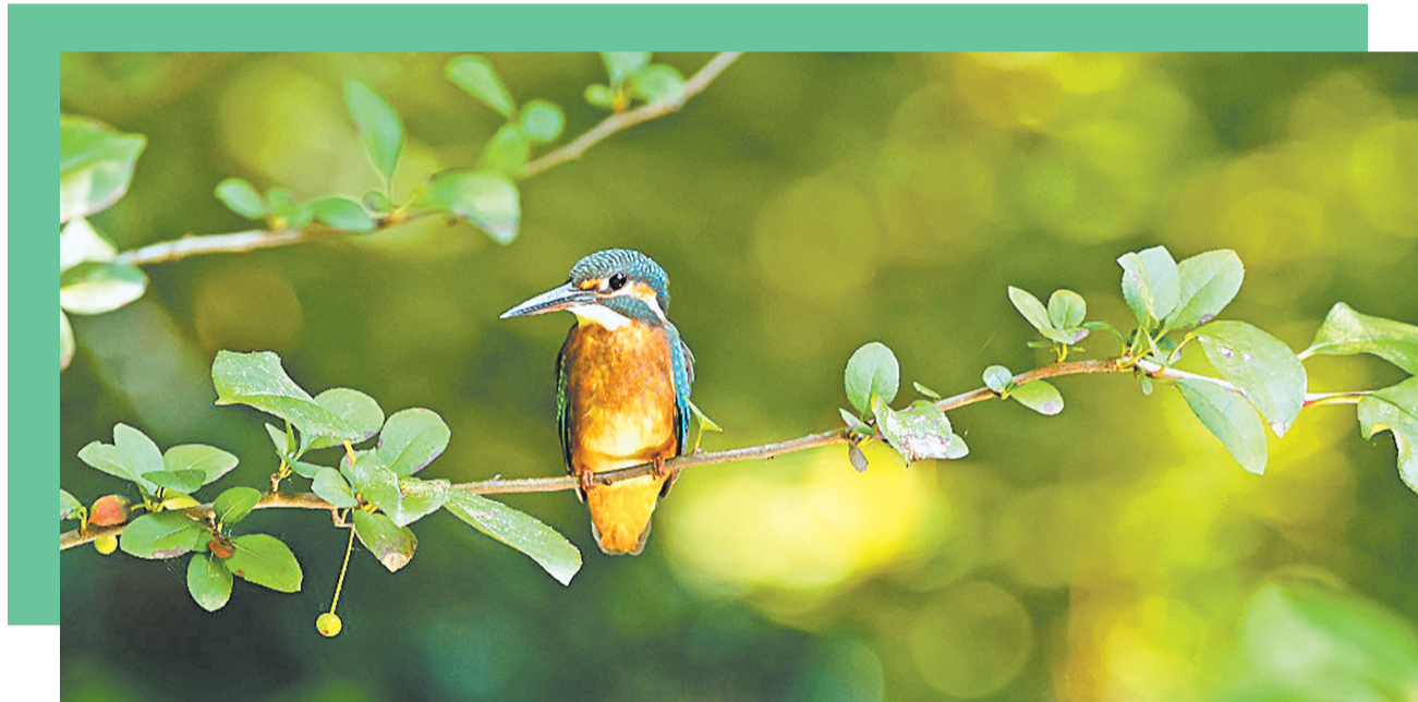
翠鸟因背部和面部的羽毛翠绿发亮而得名。