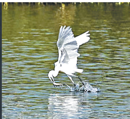
白鹭,轻盈的身姿,尽显仙气。