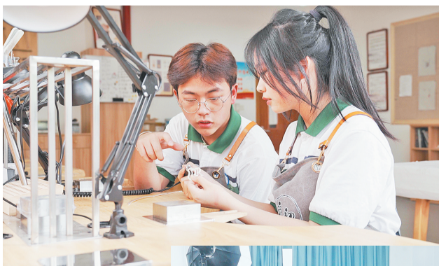
▲工美专业的学生在做首饰产品设计。

据了解,办学各方将持续推进实施“区域中高职一体化人才培养改革”,结合区域经济社会需求进一步优化试点专业结构,逐年扩大区域中高职一体化人才培养办学规模,到2028年逐步达成拥有完整专业群、10个左右专业、在校生1500人以上的区域中高职一体化人才培养改革校区规模,为高质量高水平建成世界小商品之都提供人才保障。