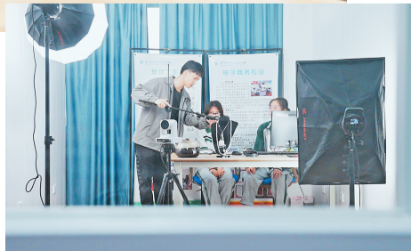
▶电子商务专业的学生在上直播课。