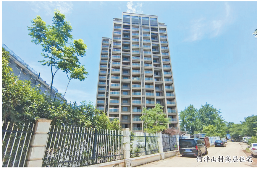
何洋山村高层住宅

城西街道相关负责人表示,全体工作人员用尽功夫把“一团乱麻”理清理顺,最终顺利推进分房选位。攻克何洋山村高层项目这个难题,不仅为村里下一步