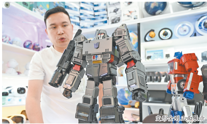
变形金刚正面展示

义乌市中国小商品城商会玩具行业商会负责人表示,目前市场上儿童陪伴型机器人的硬件水平普遍处于比较简单的阶段,想要有所提升,还需要深厚的技术能力和高昂的成本费用。因此,大部分现有产品都只是在软件层面进行挖掘;儿童陪伴型机器人并不是刚需产品,家长的消费习惯也尚未养成。从义乌市场的反馈来看,真正的行业高峰还没有出现,行业整体还处于早期阶段,但大有可为。