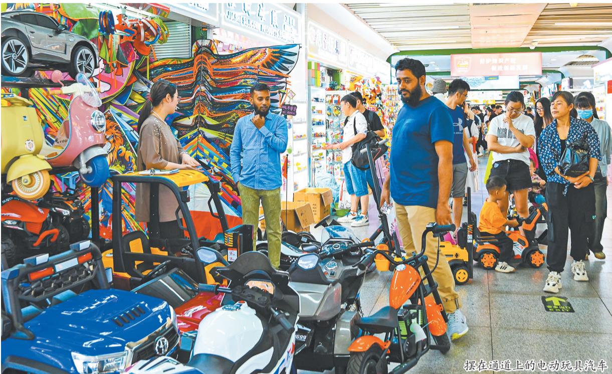
摆在通道上的电动玩具汽车