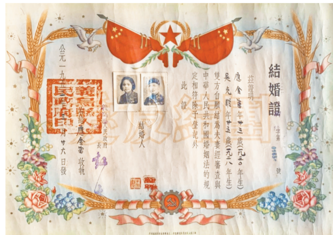
义乌早期的结婚证。