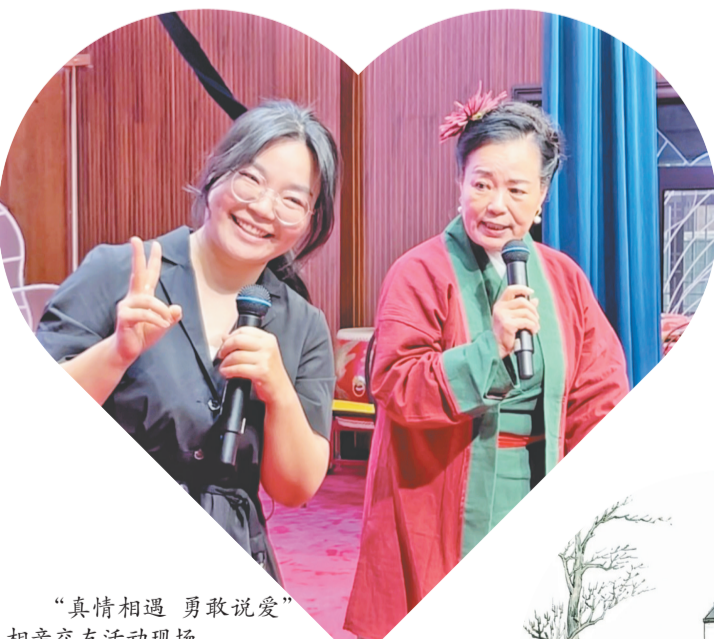
“真情相遇 勇敢说爱”相亲交友活动现场。