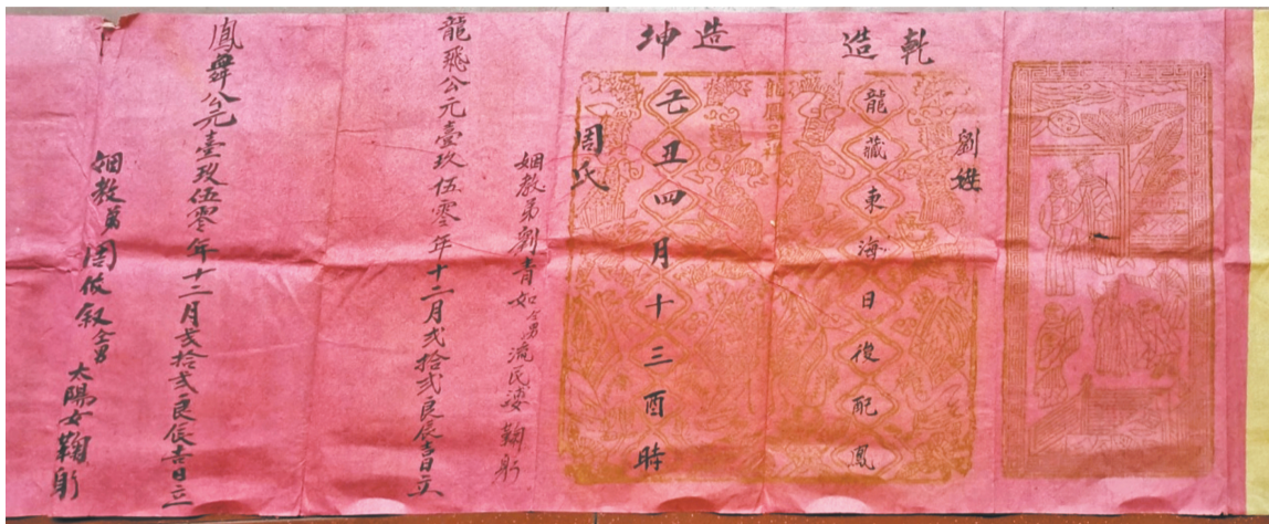
大红抹金双扇庚帖。

相亲，是我国婚姻习俗中的一个重要环节。《东京梦华录》中就有宋朝男女“相亲”习俗礼仪的记载，很多地方至今还保留着一些宋式民俗婚礼文化。红娘文化是中国传统文化的一部分。“男女无媒不交”，在义乌，媒人一直是男女婚姻得以成缘的关键角色，起着牵线搭桥的重要作用。