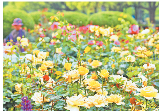
月季花开艳丽,且花期长适应性强,暗合着义乌的城市品格。