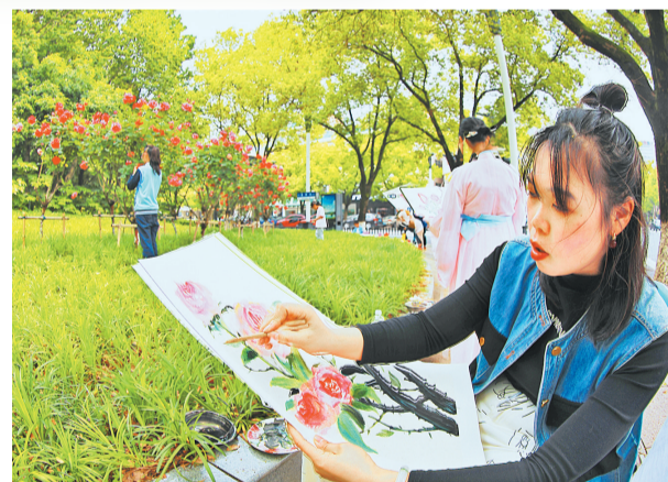
绣湖公园内,一位姑娘在用心地绘制月季花。