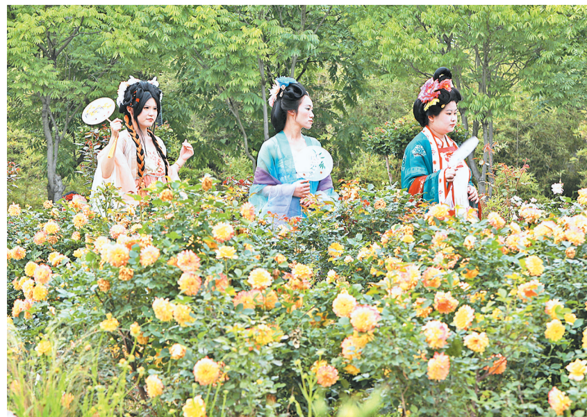
淡妆浓抹总相宜,身着古装的姑娘徜徉在月季花丛中。