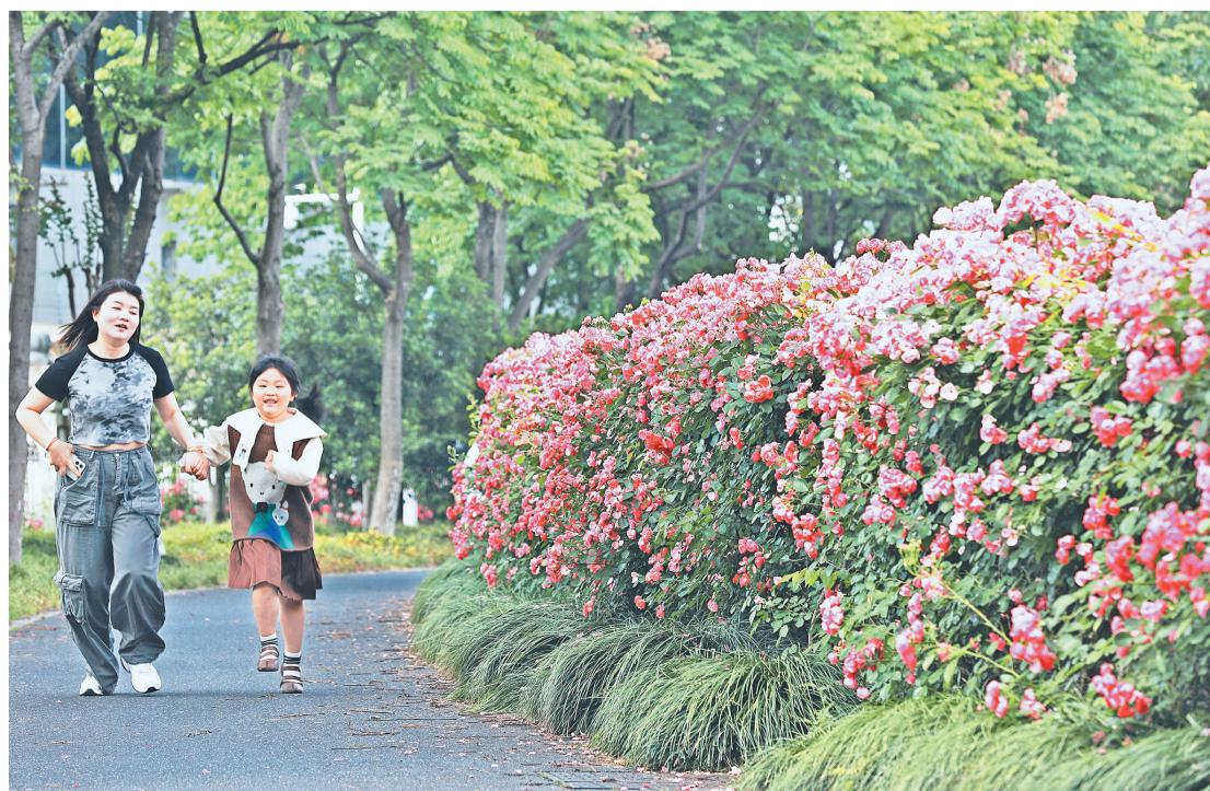
南山路上,一对母女模样的市民朋友从花墙旁跑过。