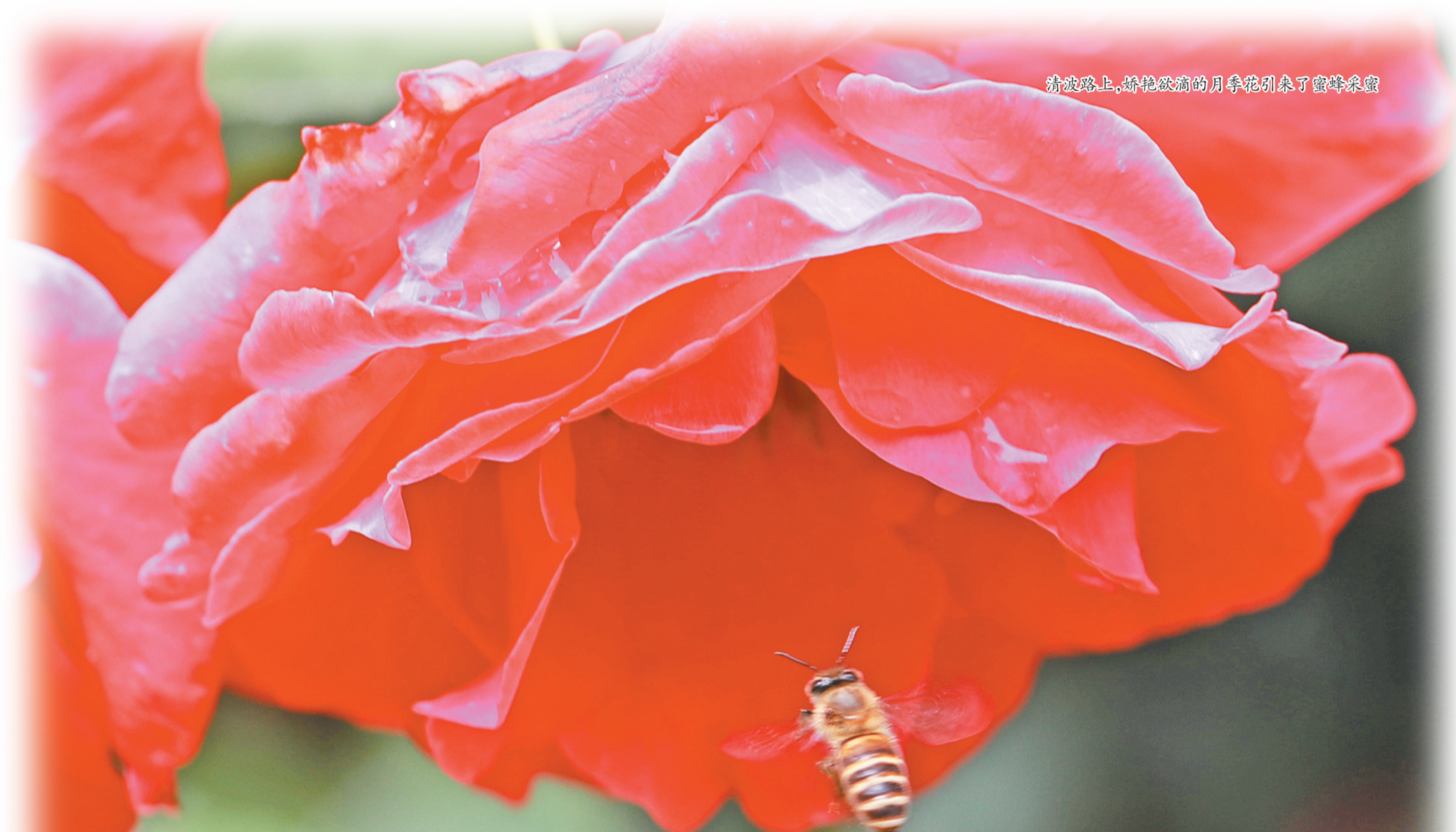
清波路上,娇艳欲滴的月季花引来了蜜蜂采蜜