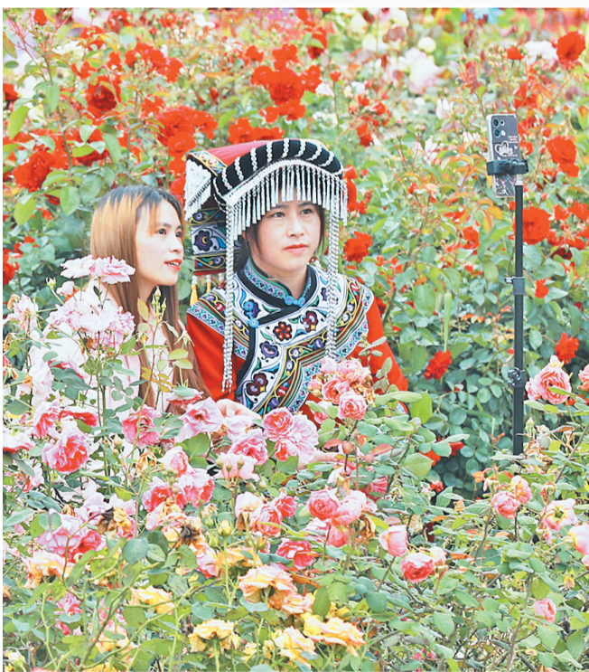
穿上民族盛装的游客在花丛中取景自拍。