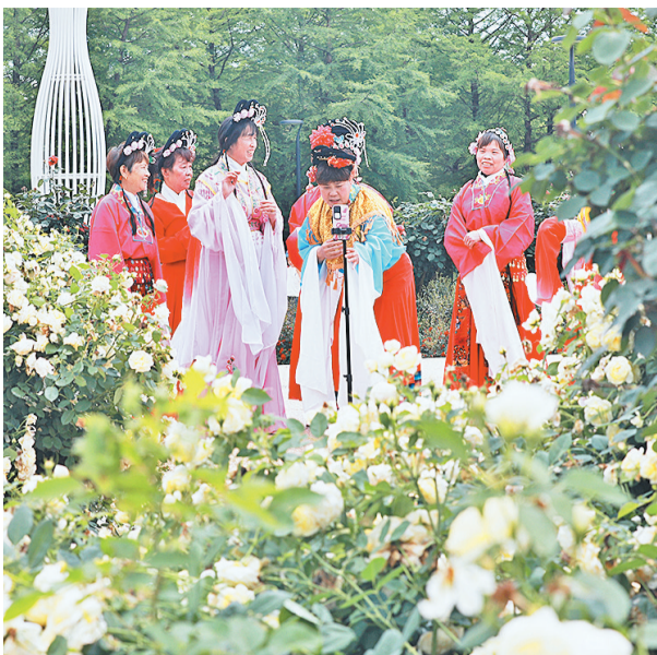
一群戏曲爱好者在月季花海中直播表演。