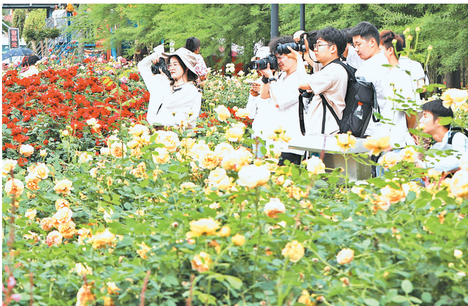
江滨路上,盛开的月季花吸引了众多摄影爱好者。