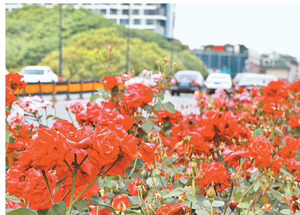
宗泽大桥上,盛开大红月季花的绿化带成为车流中的风景。