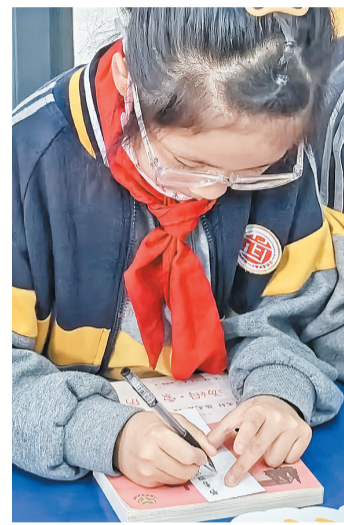
孩子们在书本上写感悟。

本报讯 4月12日,稠城街道向阳社区联合稠城第一小学,在向阳府一区开展“芳菲四月 书香向阳”世界读书日宣传活动。 大手牵小手,一起来阅读。第29个“世界读书日”即将来临,主办方通过家校社合作,让孩子们进小区、进家庭,以面对面赠送一本书的方式开展沉浸式宣传,传播阅读的快乐。在活动地点集合后,孩子们在事先准备好的书籍上写上简短的祝福语或感悟,然后在社区工作人员和志愿者的引导下,逐一送到居民家中。 “叔叔好,我是稠城一校401班的学生,我们在开展世界读书日宣传活动,您知道世界读书日是哪一天吗?”您平时有阅读的习惯吗,会陪着您