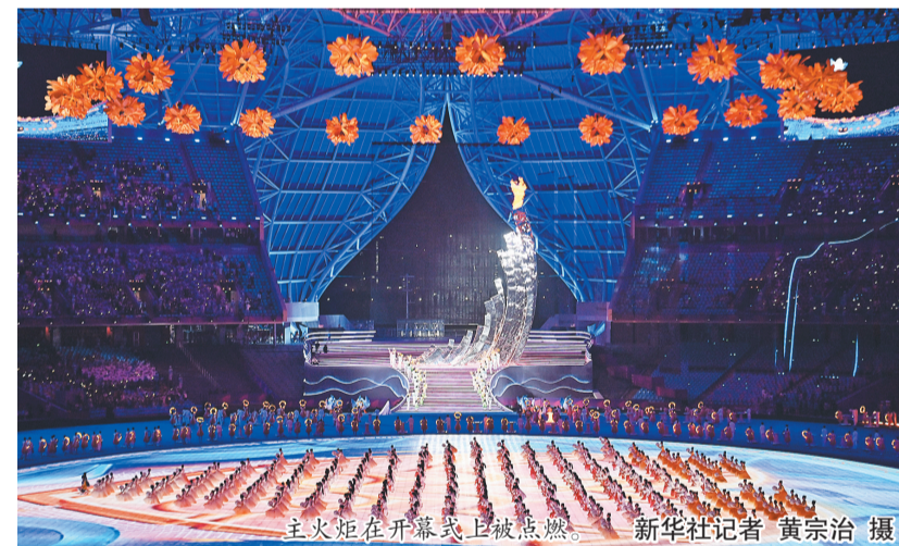
主火炬在开幕式上被点燃。

新华社杭州10月22日电(记者齐中熙 夏亮)相聚钱塘江畔,奏响逐梦乐章。杭州第四届亚洲残疾人运动会22日晚在杭州隆重开幕。国务院副总理丁薛祥出席开幕式并宣布本届亚洲残疾人运动会开幕。 杭州奥体中心体育场灯火璀璨,流光溢彩,宛如一朵美丽的“大莲花”。现场4万多名观众欢声笑语,共同分享这一难忘时刻。 践行“阳光、和谐、自强、共享”办赛理念的本届亚残运会,是中国继北京冬残奥会后举办的又一个国际残疾人体育盛会,也是按照“两个亚运同样精彩”精神举办的一次亚洲体育盛会。 19时30分许,在欢快激昂的乐曲声中,丁薛祥同亚残奥委员会主