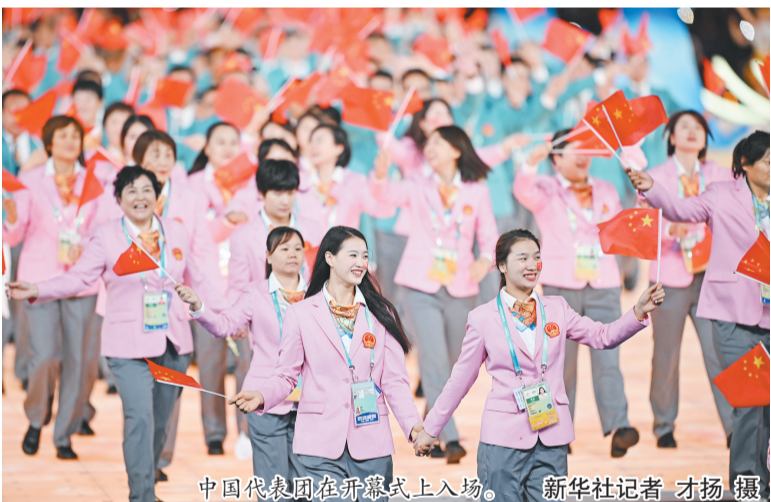
中国代表团在开幕式上入场。