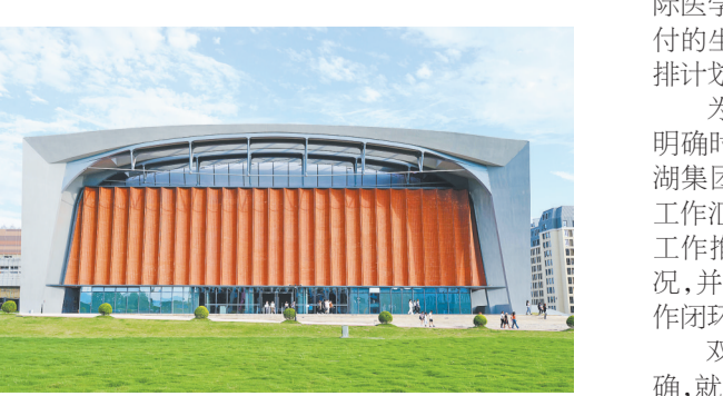
体育中心造型颇具现代艺术感,设计灵感来自“扬帆起航”。

9月8日晚,记者来到双江湖科教园区浙江大学“一带一路”国际医学院建设现场,400余名工人仍坚守岗位,挥汗如雨,各大组施工现场声势浩大,热火朝天,主体建筑全面交付,绿化小品连片成景,市政基础逐步成型。