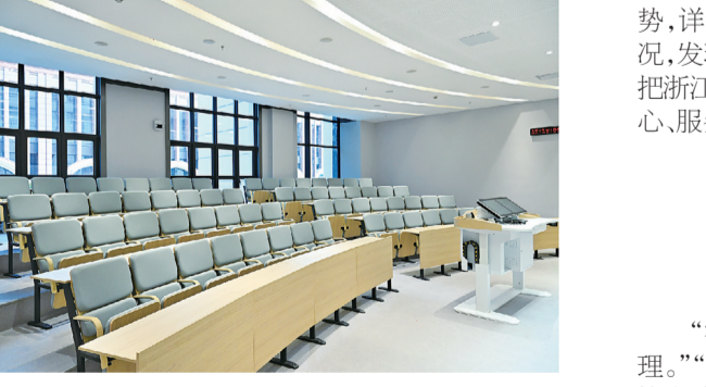
功能先进的多媒体教室。