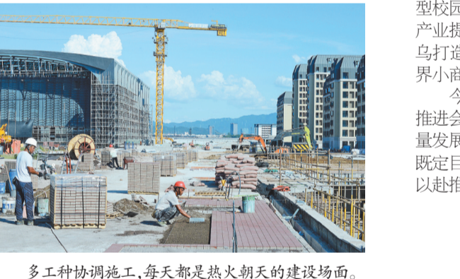
多工种协调施工,每天都是热火朝天的建设场面。