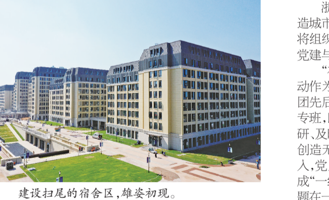
建设扫尾的宿舍区,雄姿初现。