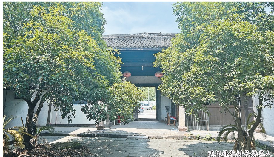
两棵桂花树长得喜人