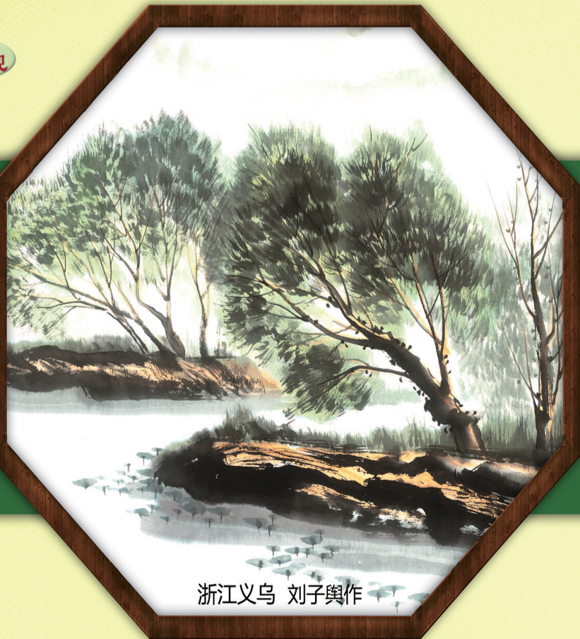
浙江义乌 刘子舆作