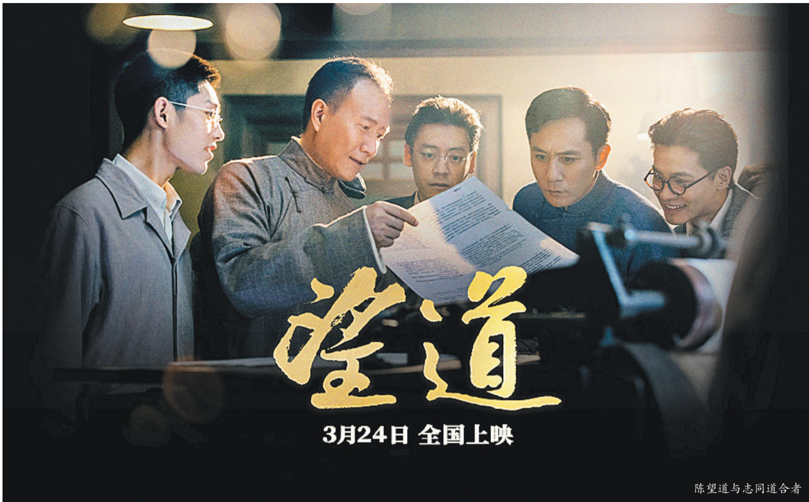
陈望道与志同道合者