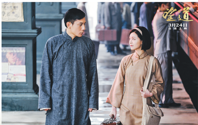
演员刘烨与文咏珊