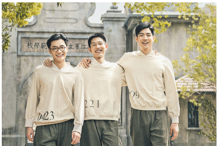
演员王锵、苏豪与梁霆炜