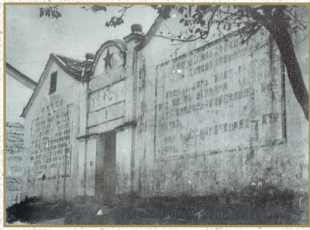
1942年7月7日,金义联防第八大队在义乌下宅祠堂成立。