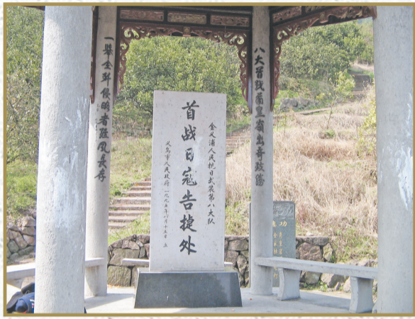
第八大队首战日寇告捷处纪念碑