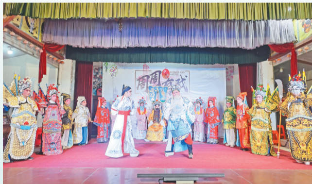
《周周有戏》文艺节目在麒麟之声戏曲大舞台上演。