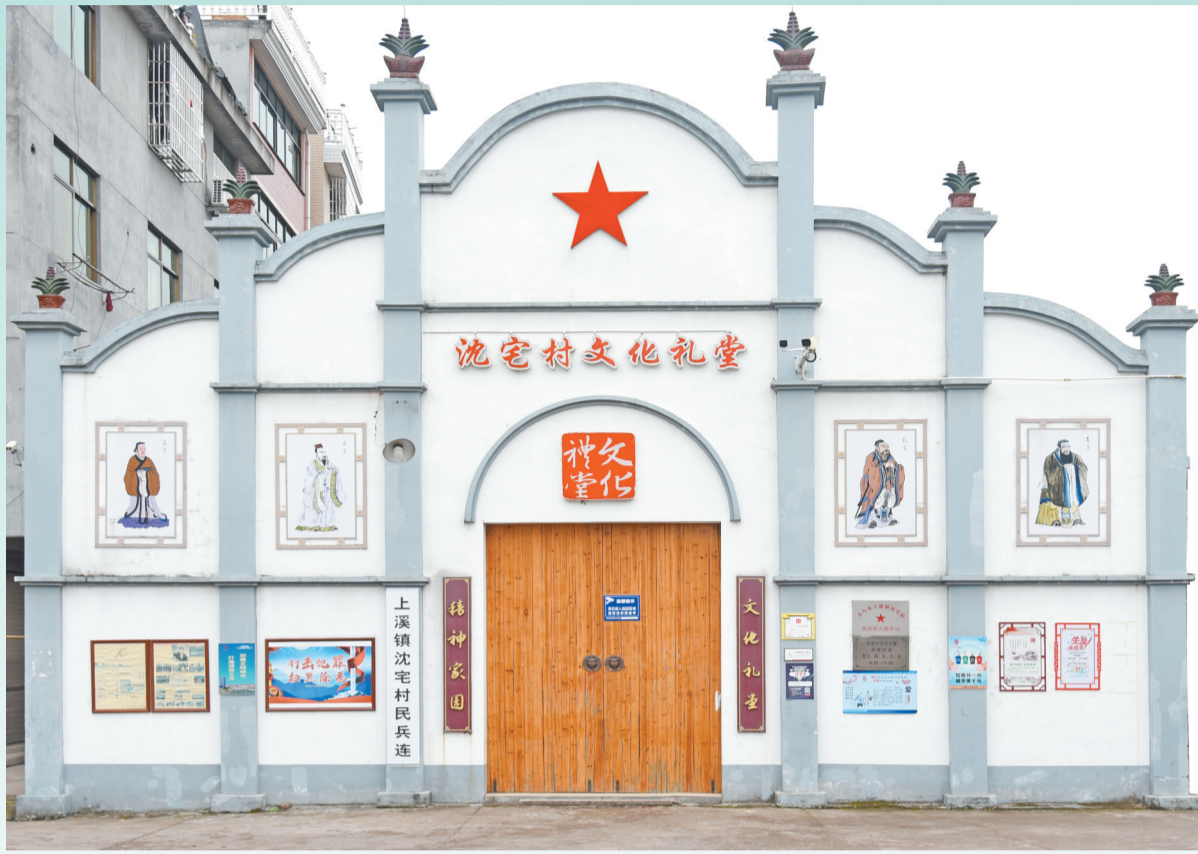
沈宅村文化礼堂外观恢宏气派。

2014年11月，沈宅村文化礼堂建成以后，立被评为三星级文化礼堂。今年4月，2021年度浙江省五星级农村文化礼堂名单公布，沈宅村文化礼堂亦榜上有名。沈宅村文化礼堂内涵丰富、精彩纷呈，是村里日常活动的聚集地，也是村民精神文明的栖息地。