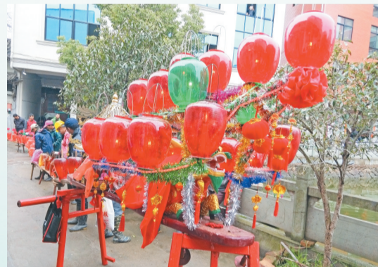
迎珠灯是沈宅村独具特色传统之一。

每当夜幕来临，沈约公园内一派灯火辉煌，人声鼎沸。一曲悠扬的《喜闹花台》民乐演奏拉开了序幕，义乌道情《十杯香茶》、婺剧彩妆正本大戏《三清梨花》《百寿图》等大家喜闻乐见的文艺节目齐齐亮相。