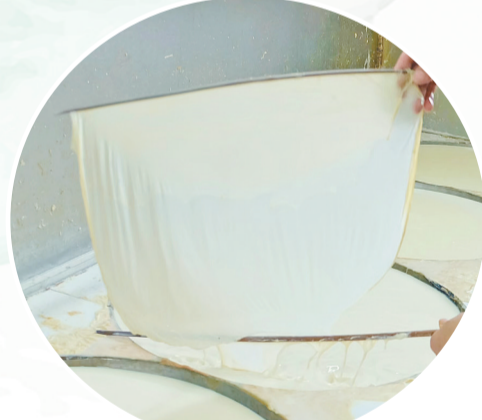
豆腐皮刚捞上来的瞬间。