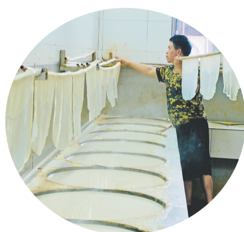
从十几口锅里捞出豆腐皮。