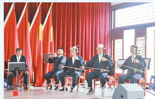
全媒体记者 谭祉潇 文/图

近日,廿三里街道上社村“夕阳红”民乐队成立。在成立仪式上,民乐队现场表演了民乐合奏《花头台》、传统曲艺《弹八仙》等节目,精彩纷呈的演出,获得了村民们的阵阵掌声。