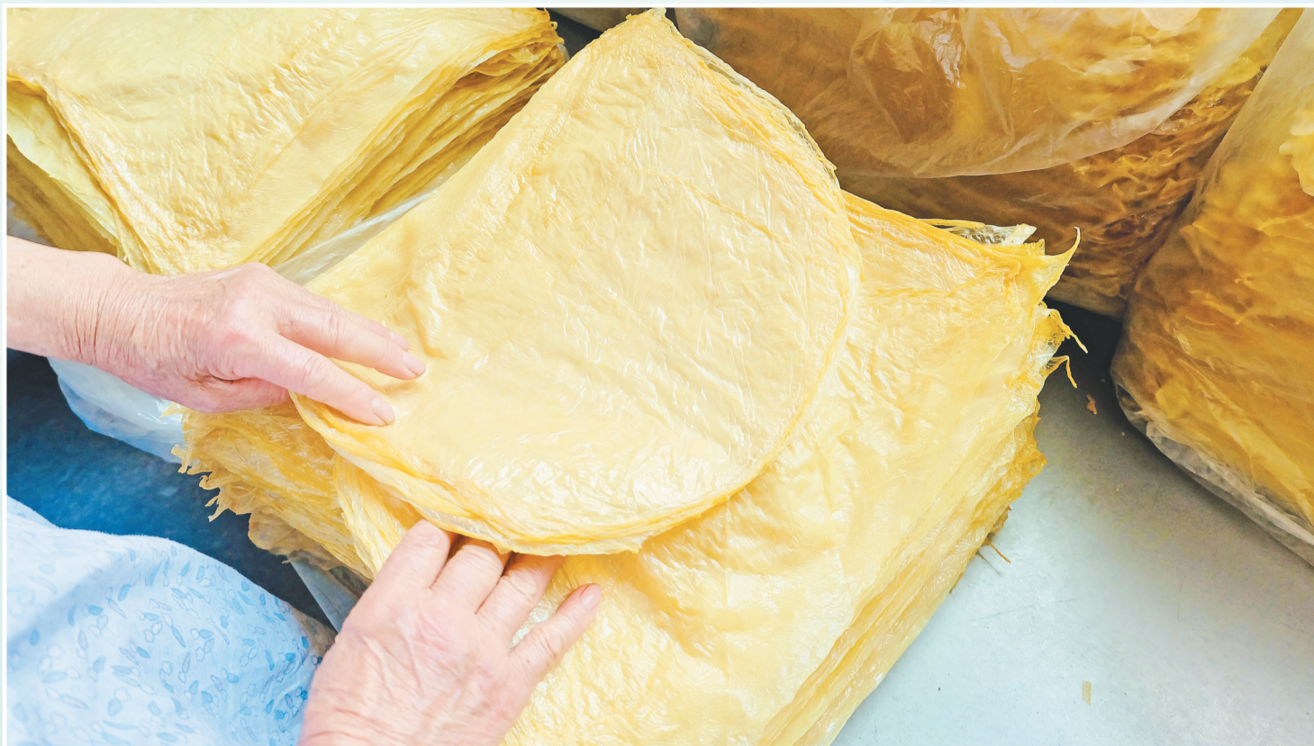
色泽鲜明的豆腐皮。