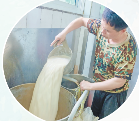
工人将醇香的豆浆倒入锅中。