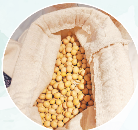
豆腐皮的原材料黄豆。