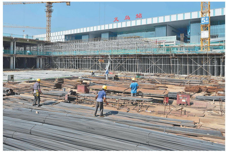
国庆节期间,在我市的各个省市重点工程建设现场,施工工人坚守一线,在铁路义乌站综合交通枢纽站前广场建设现场,工人们加班加点进行钢筋绑扎等施工,严格按照标准化施工要求,做精做细每一道施工环节,力争打造质量优、品位高的精品工程。