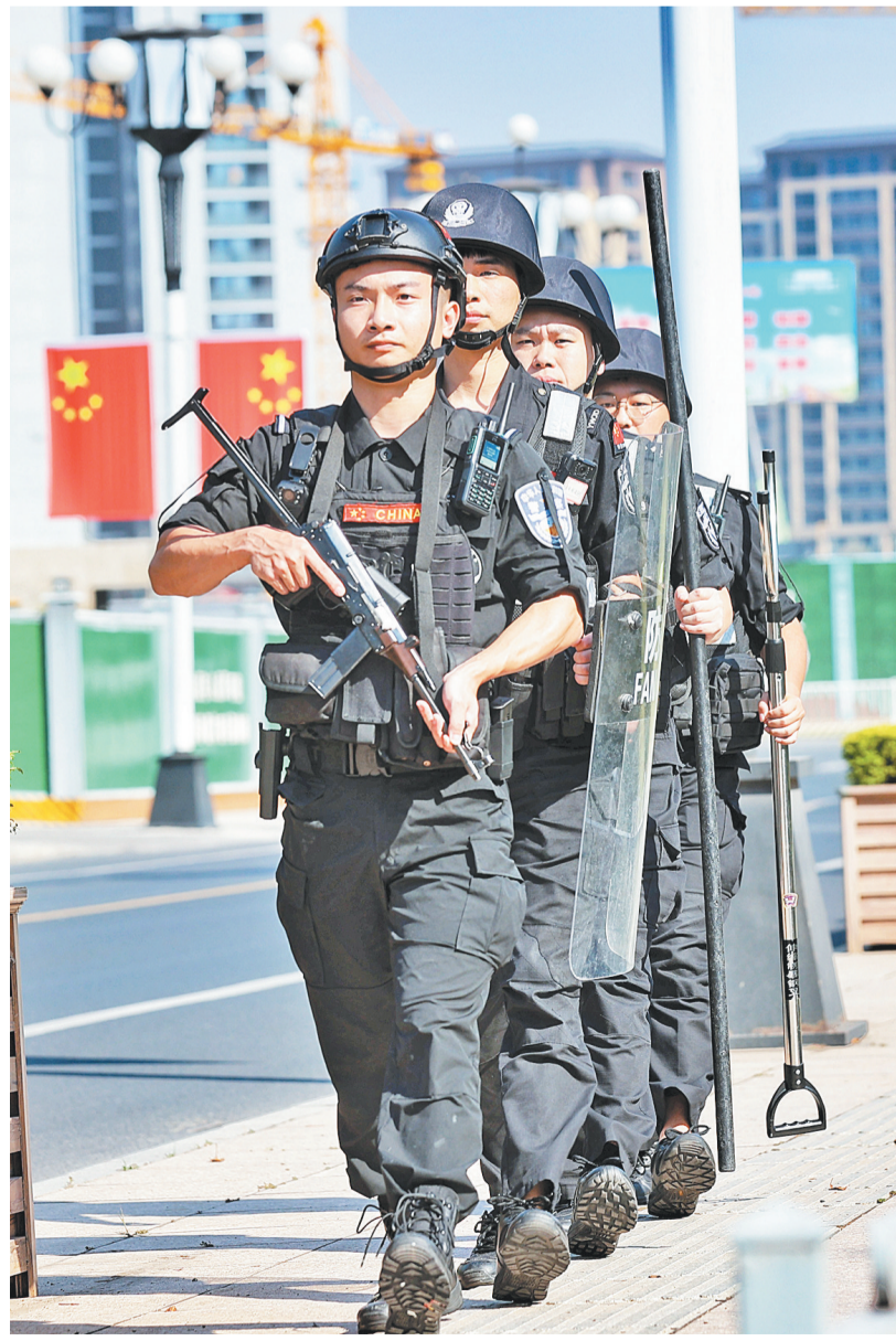
国庆节期间,市公安局以维护社会安定为目标,全力开展巡逻防控工作,在商业街、购物公园、车站周边等人流密集地段开展徒步巡逻,切实提升街面警力,全力营造平安、祥和、快乐的节日氛围。