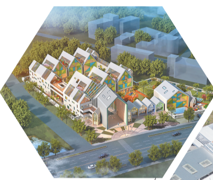
佛堂镇实验幼儿园效果图。