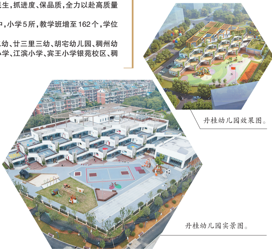
丹桂幼儿园效果图。

城投集团为确保续建项目有序推进,抓实“三服务”工作机制,提前谋划,统筹兼顾,科学部署,强化落实,全过程跟踪查看进展情况,着力解决专项验收过程中堵点难点,帮助建设工程突破困局,督促工作进度,定期检查汇报,坚决打赢项目秋季投用攻坚战。同时全面推行首问负责制、限时办结制、职责追究制,坚持问题导向,发挥党员先锋模范作用,成立项目青年突击队,啃最硬的“骨头”,攻最难的“碉堡”,确保项目学校如期完成建设顺利开学。