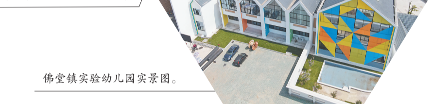
佛堂镇实验幼儿园实景图。