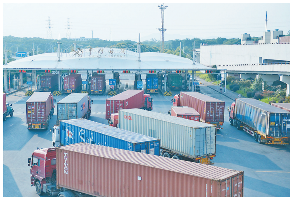
义乌海关监管场所车辆有序排队离场驶向宁波舟山港。

据不完全统计,目前已有7家船公司在义乌设立分支机构,20家船公司在义乌开展提还箱业务,6家船公司在义乌开展订舱业务;5家船公司在义乌开展签发提单业务,4家船公司在义乌开展多式联运业务。其中,不乏中远海、达飞、马士基、地中海等航运巨头。