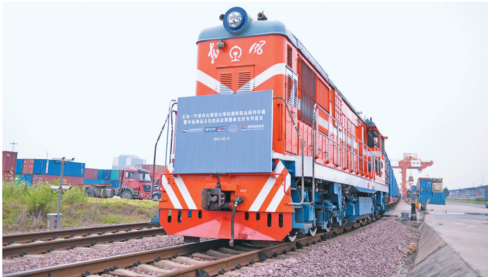
义乌—宁波舟山港海铁联运班列鸣笛启程。

事实上,在国际贸易惯例中,谁拥有了船公司签发的海运提单,谁就拥有了船公司所承运的货物所有权,之后所有的港口业务也将从这一张海运提单延伸出去。也因此,一个城市的名称是否会出现船公司签发的提单上,成为了一个城市是否真正是港口城市的业内指标。作为全球第三大集装箱班轮公司的“达飞”认可义乌内陆港的地位,无疑将带动其他船公司陆港业务延伸至义乌,这对把义乌国际陆港打造成为内陆物流枢纽,宁波舟山港“第六港区”的工作目标,具有十分重要的现实意义。