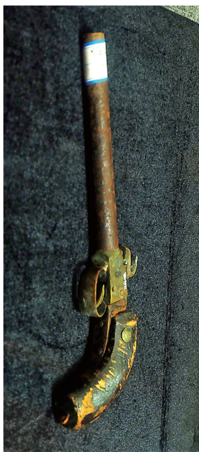
坚勇大队用过的短鸟銃。

当年,为了巩固和发展根据地,金义浦兰抗日根据地和诸义东抗日根据地分别把群众工作当作大事来抓。他们建立了村一级农抗会,团结广大农民自主当家,积极参加抗日运动;成立妇女救国会,开展拥政拥军和优待抗日军属活动,为八大队伤病员服务,为部队分忧;建立抗日自卫队和民兵组织,维持社会治安、保卫地方,配合部队打仗;成立儿童团、少年团,从儿童抓起,开展抗日宣传,组织他们站岗放哨,盘查过路行人,防止混入坏人,成为自卫队、民兵的助手。我们在展厅现场还能看到当年儿童团、少年团的展品《抗日救国歌手抄件》,以及义乌市东河区前洪乡前洪上村自卫队儿童队员名册。