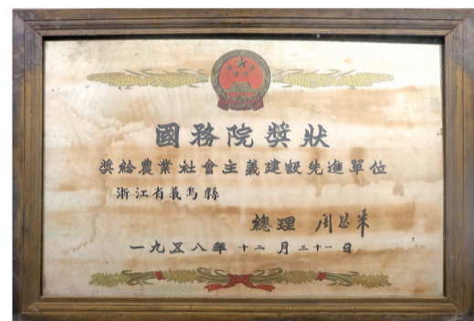
1958年,国务院颁给义乌县的“农业社会主义建设先进单位”奖状。