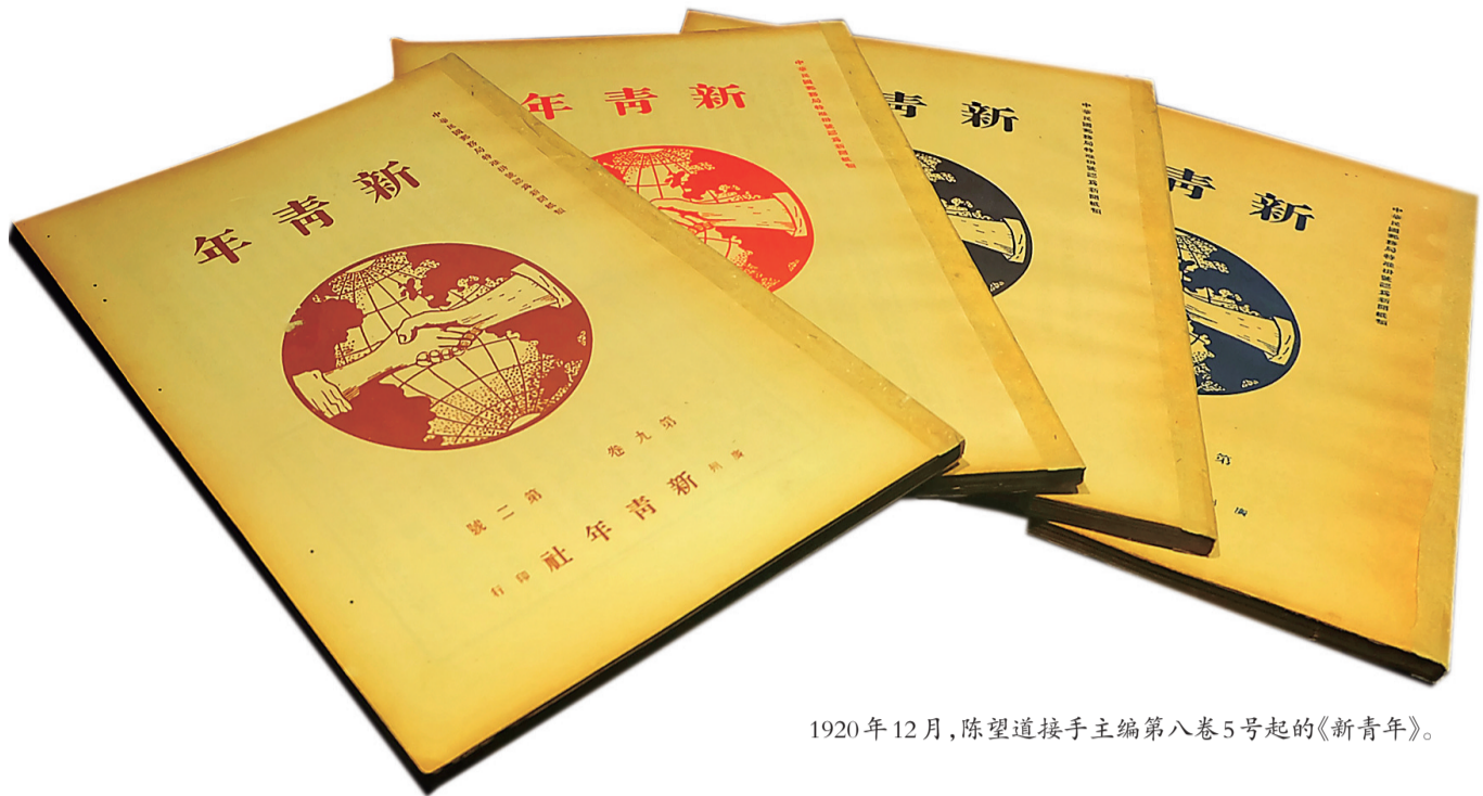
1920年12月,陈望道接手主编第八卷5号起的《新青年》。