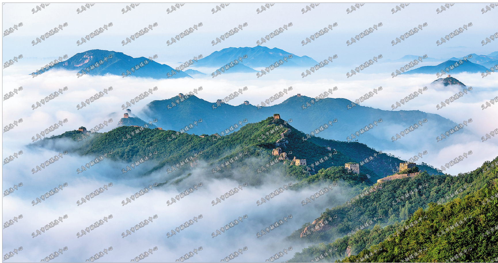
巨龙腾飞