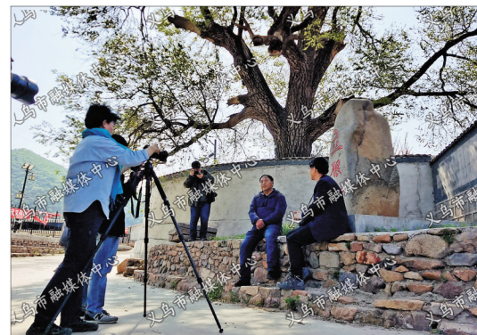
义乌兵古村落立根台村,秦皇岛市的摄影家邱琳等全程记录义乌团队的拍摄经过。