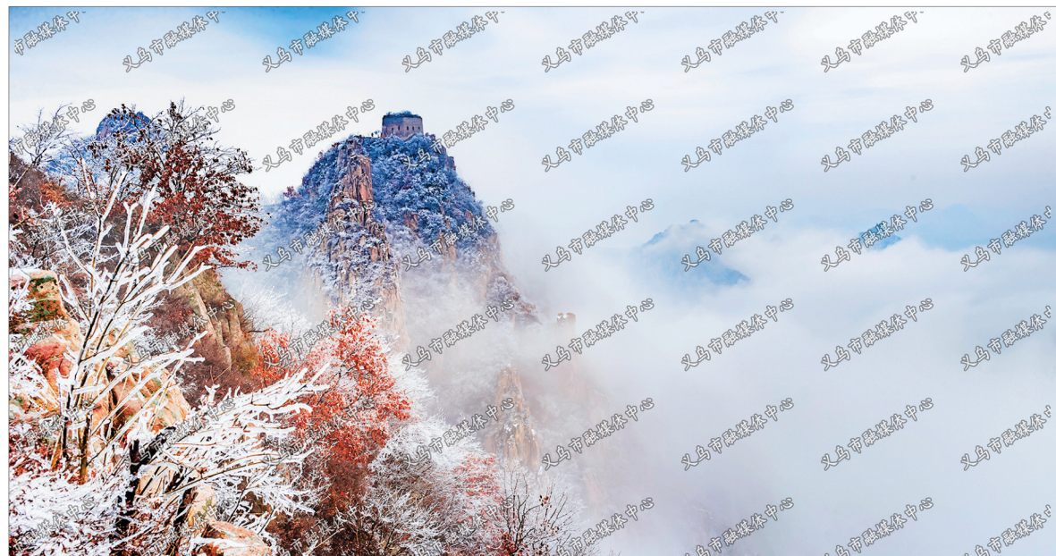
板厂峪冬韵