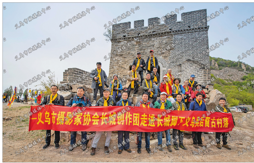
义乌、秦皇岛南北两地摄影人,相聚于板厂峪长城脚下。