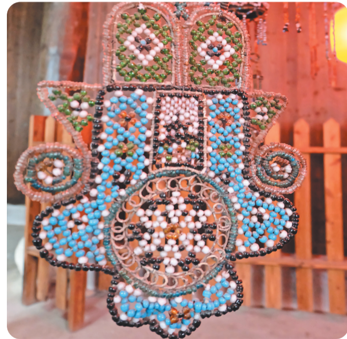
修补后较为完整的串珠。