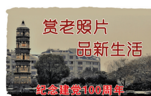
纪念建党100周年系列之一