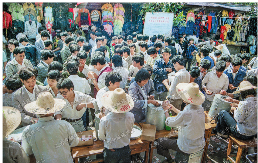
图片《爱的奉献 心的呼唤》

上个世纪九十年代，在农村集市上，城里社区聚会时，经常举办社会福利有奖募捐活动，人们花上几元或几十元钱，摸福利彩票，满心期望摸中汽车、彩电、冰箱等大奖。这项由国家民政部发起的公益募捐活动，助人益己，利国利民，体现爱心和奉献的时代风尚。 此照从摸奖现场抓拍活动一景，富有时代气息，于1991年12月被中国摄影家协会、国家民政部等单位联合评为首届社会福利有奖募捐摄影展最佳奖。